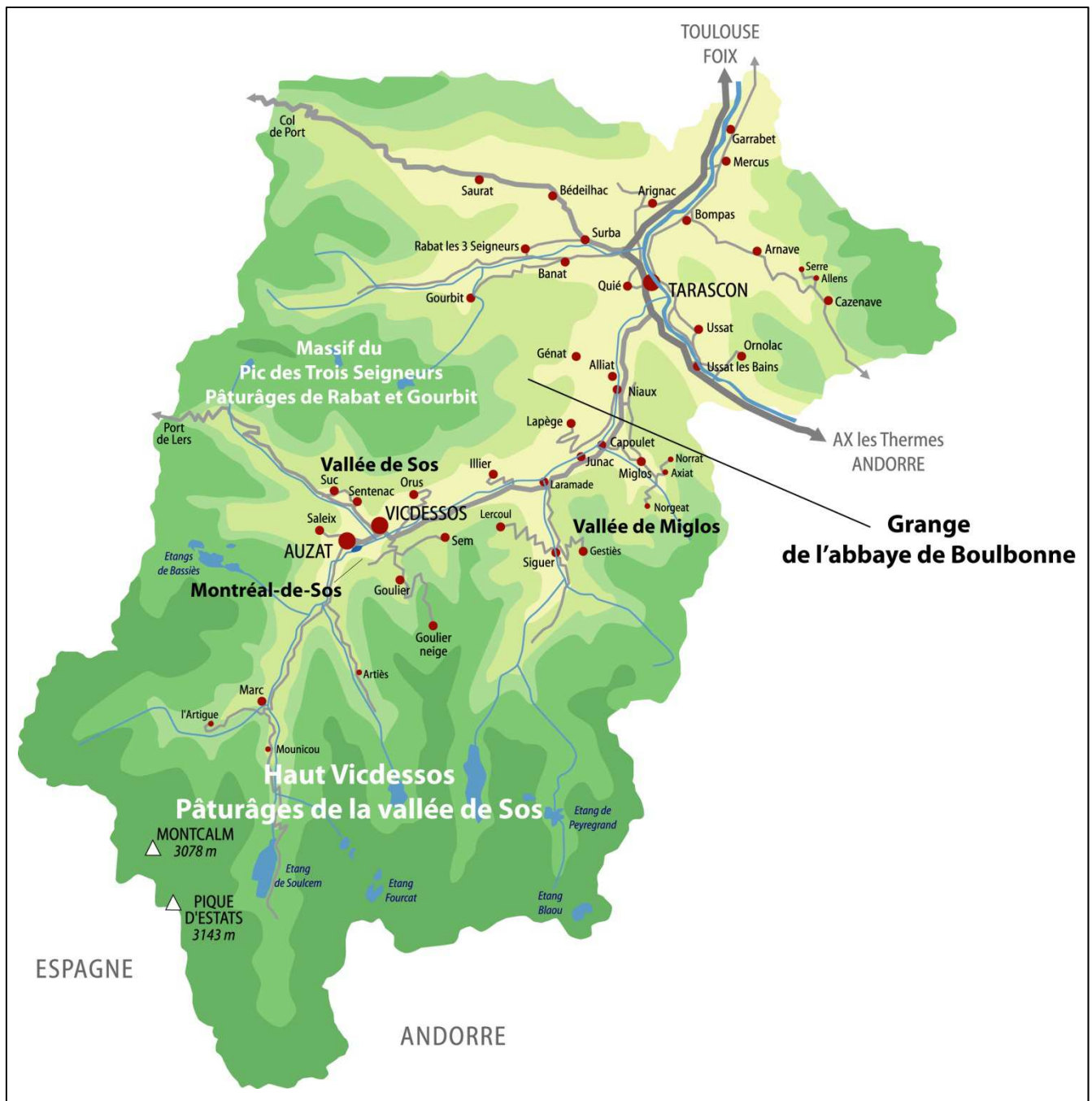
Fig. 1. Situations.

Finalement donc, lorsque l'activité pastorale apparaît pour la première fois dans la documentation écrite, au XII e siècle, elle est déjà multimillénaire, et surtout fondamentalement constitutive de la société en place.