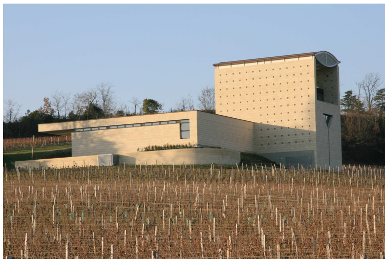
Photo. n° 2 : Le nouveau chai du Château Faugères, dessiné par l'architecte international Mario Botta en 2009. Cliché R. Schirmer, 2011.

Des questions techniques et environnementales sont également à prendre en compte pour comprendre ce renouveau architectural. C'est tout d'abord la recherche de l'excellence qualitative qui suscite la rénovation de certains domaines. L'utilisation de la gravité, afin de manipuler le raisin le moins possible pour préserver sa qualité, conduit à repenser les domaines et à construire de nouveaux bâtiments, comme pour les chais du château Faugères (Saint-Étienne-de-Lisse) (photo. n° 2).