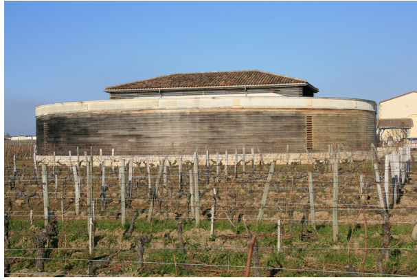
Photo. n° 4 : Le chai du Château La Clémence, mélangeant pierre blonde et bois, de forme ronde assez iconoclaste dans le vignoble de Saint-Émilion.