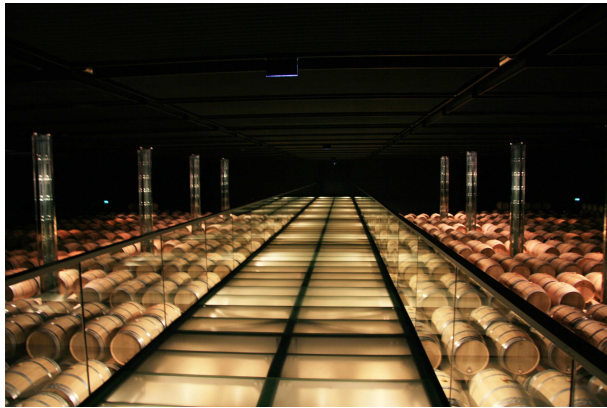
Photo. n° 5 : Vue intérieur du chai du Château Cos d'Étournel, rénové par l'architecte Jean Michel Wilmotte. La mise en scène d'un lieu autrefois fermé au public. Cliché R. Schirmer, 2012.