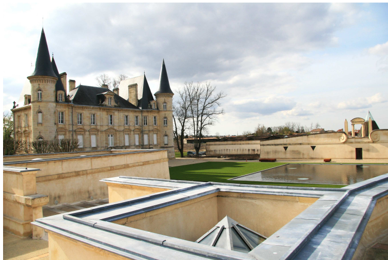
Photo. n° 1 : Le nouveau chai du Château Pichon-Longueville, une réinterprétation du néo-classicisme de l'Époque Moderne.

La longue période de léthargie dans laquelle la création architecturale s'est trouvée plongée au XX e siècle est plus surprenante. Même l'exposition Château Bordeaux, tenue en 1988 à l'initiative du Centre Beaubourg, n'a pas réussi à amorcer un grand renouveau ( Châteaux Bordeaux , 1988). Seul le château Pichon-Longueville (Pauillac) s'illustre alors en créant un nouveau chai (photo. n° 1) en 1989 (architectes Jean de Gastines et Patrick Dillon).