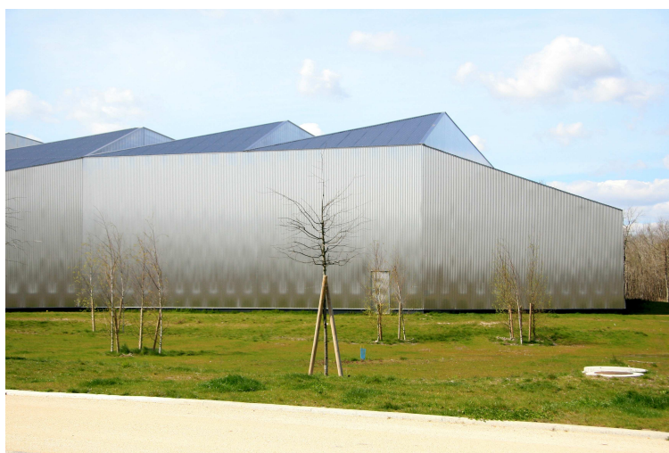
Photo. n° 3 : La Winery, la transposition d'un paysage du Nouveau Monde en plein Médoc.