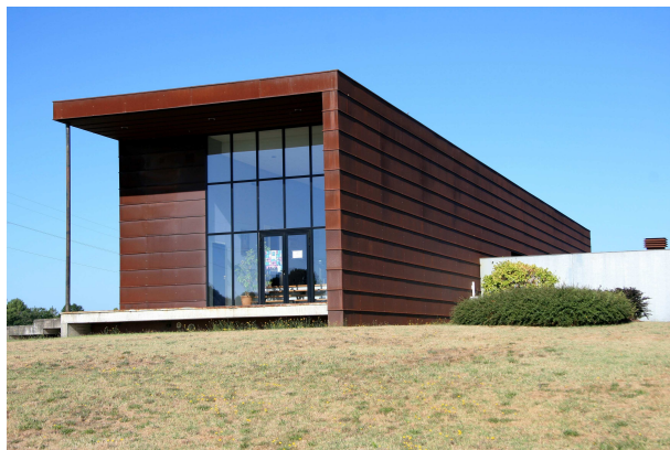
Photo. n° 6 : Le Château de La Tour de Bessan, l'audacieuse transformation d'un bâtiment technique en un « château » bordelais. Cliché R. Schirmer, 2011.

Une nouvelle tendance se fait néanmoins jour. Elle provient dans une large mesure de discours architecturaux en cours dans le Nouveau Monde (HARTJE, PERRIER, 2005) qui tendent à