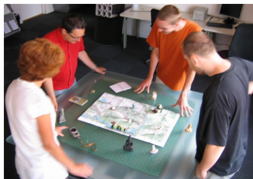
Figure 2 : Utilisation de la table dans un environnement collaboratif

Emitting Diode) intégrées au nombre de 4 dans chaque antenne. Ces diodes permettent, par exemple, un retour utilisateur lors d'un déplacement d'objet. La seconde solution est la projection d'une image à la surface de la table grâce à un vidéoprojecteur disposé au-dessus de celle-ci. L'image projetée permet un visuel de l'application et permet également d'ajouter de la réalité sur les objets tangibles en écrivant par exemple virtuellement sur une feuille qui elle, est bien réelle.