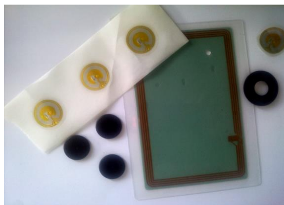
Figure 1 : Présentation en image d'étiquettes RFID

Les étiquettes actives ou semi-actives possèdent quant à elles une alimentation qui leur est propre (une pile interne extra plate). Elles permettent aussi bien la lecture que l'écriture des données. Elles permettent des distances de détection supérieures à celles de l'étiquette passive. Notons toutefois que les étiquettes semi-actives n'utilisent pas leur alimentation afin d'émettre des signaux de communication. Leur alimentation permet, par exemple, d'enregistrer des données de traçabilité lors d'un déplacement d'objet.