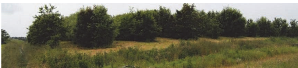
Figure 2. État actuel de l'ISDnD de Lann Hir