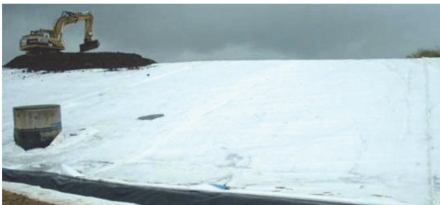
Figure 5. Mise en œuvre du sol de couverture

Sur le site de Lann Hir, les camions étaient autorisés à circuler sur des rampes d'accès de 80 cm d'épaisseur. Le régalage des matériaux se faisait alors à partir de la rampe, à l'aide d'un engin monté sur chenille, autorisé à circuler sur une couche d'au moins 40 cm d'épaisseur.