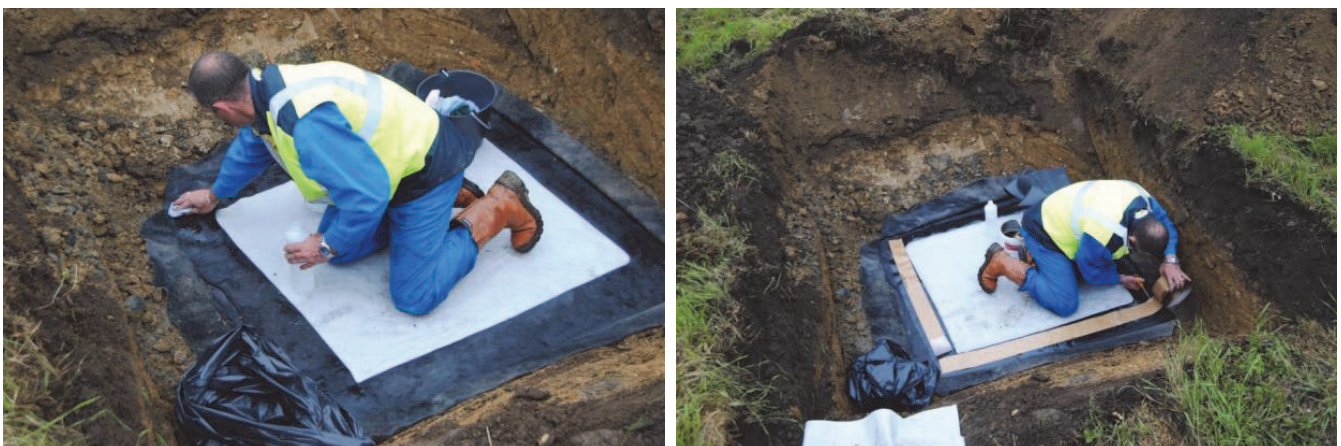
Figure 7. Nettoyage et réparation de la géomembrane EPDM

De nouvelles pièces de géotextile de protection ont été placées dessous et au-dessus de la géomembrane. Au final, le sol de couverture a été remis en place.