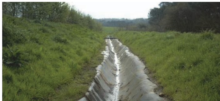
Figure 3. Fossé périphérique en pied de dôme réalisé en géomembrane EPDM