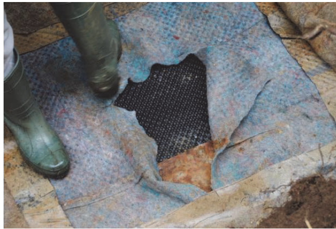
Figure 17. Géotextile de protection et géocomposite drainant des gaz placés sous la géomembrane

Le géocomposite de drainage des gaz situé sous la géomembrane et le géotextile de protection inférieur étaient encore en très bon état. Il n'a pas été observé de colmatage de la zone drainante.