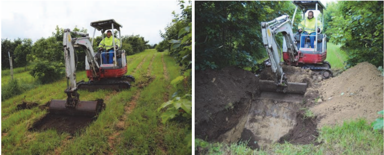
Figure 11. Début de l'excavation pour prélever les échantillons