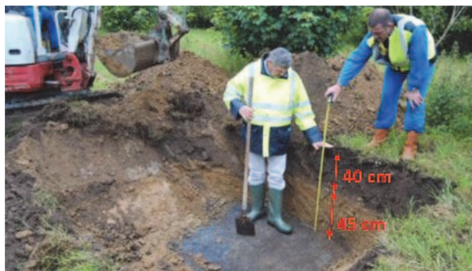
Figure 15. Sommet du dôme – Coupe du sol de couverture et état du géotextile supérieur de protection

On a également pu observer que les épaisseurs du sol de couverture avaient bien été respectées (Figure 15). L'excavation a montré que les racines de la végétation plantée sur la couverture sont restées dans les 40 premiers centimètres de la terre arable (Figure 16).