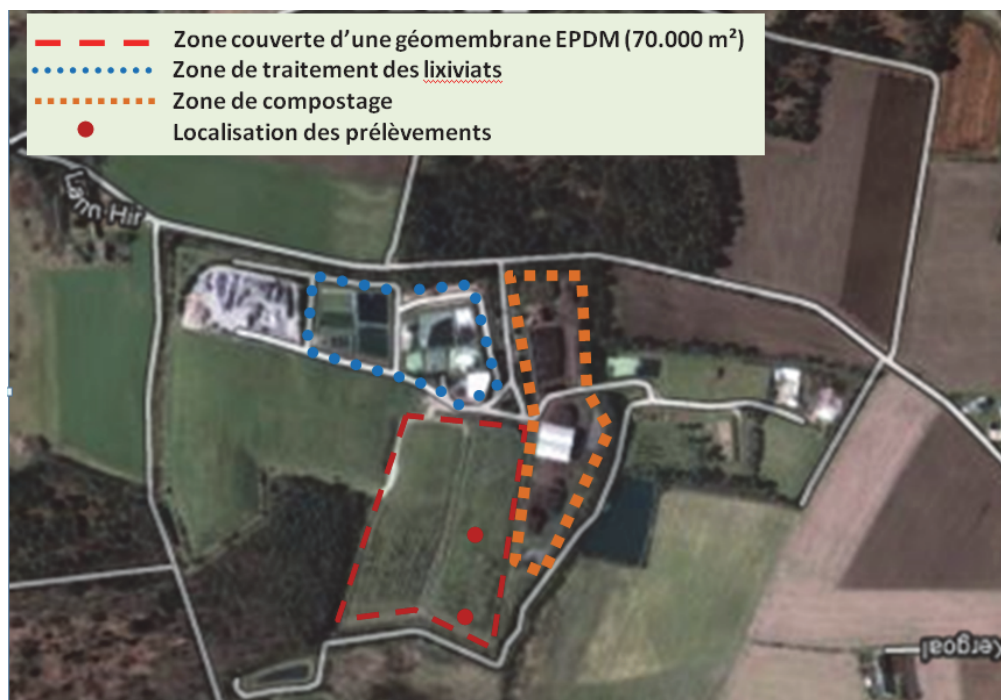
Figure 1. Vue aérienne de l'ISDnD de Lann Hir

Les travaux se sont déroulés en neuf tranches de 2000 à 2008.