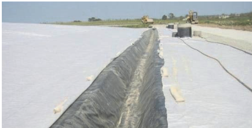
Figure 4. Installation du fossé périphérique et du géotextile de protection supérieur