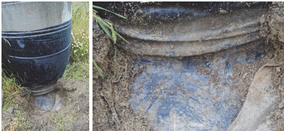
Figure 18. Puits de dégazage – vérification du détail de connexion

L'observation visuelle montre que la connexion entre le puits et la géomembrane n'a pas souffert du tassement différentiel (Figure 18). Visuellement, la géomembrane ne s'est pas mise en tension et il reste encore une quantité significative de géomembrane excédentaire pour pallier les tassements ultérieurs potentiels.