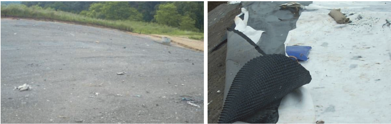
Figure 5. Couche de reprofilage avant installation du DEG et géocomposite de drainage des gaz