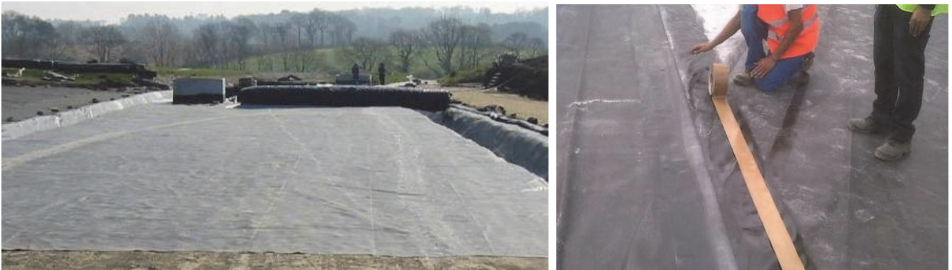
Figure 6. Installation de la géomembrane EPDM. Réalisation d'un joint à l'aide d'une bande autoadhésive

nombre de joints à réaliser sur chantier réduit les risques liés à l'installation et la dépendance de la mise en œuvre aux conditions climatiques.