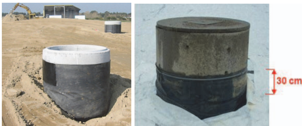
Figure 10. Puits de dégazage avant et après la réalisation du pli d'aisance