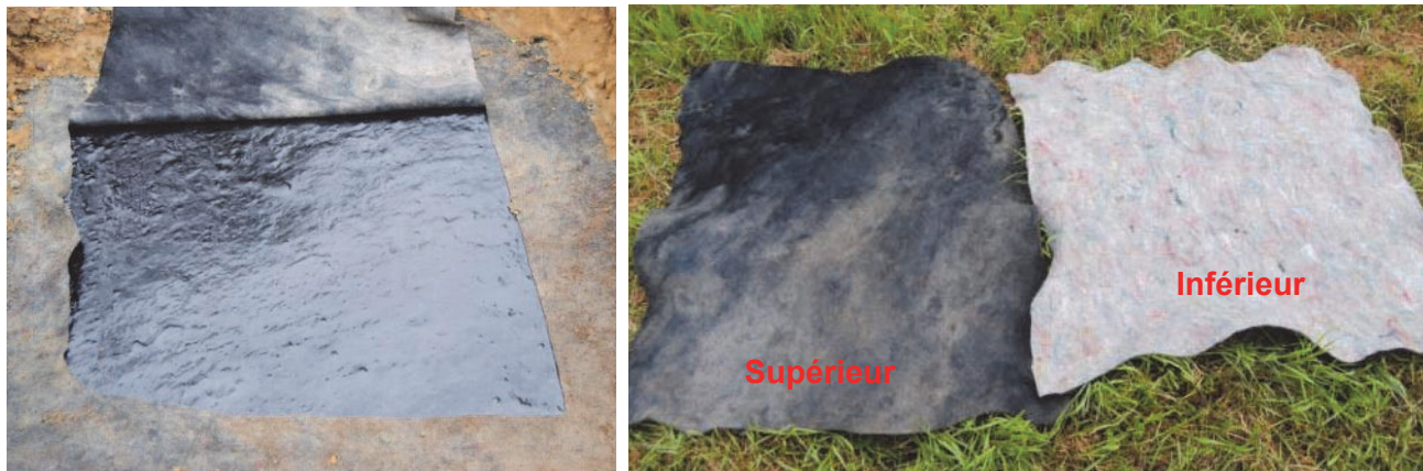
Figure 14. Géomembrane EPDM et différence de couleur entre le géotextile supérieur et inférieur

Les pièces de géomembrane prélevées ne présentaient ni défaut, ni perforation visible. Les géotextiles de protection (supérieurs et inférieurs) étaient également en très bon état de conservation. Il est à noter que le géotextile supérieur était fortement coloré (l'origine de la coloration n'a pas été déterminé) alors que le géotextile inférieur avait gardé sa couleur d'origine (Figure 14). Cette observation montre le rôle de la géomembrane qui prévient des infiltrations.