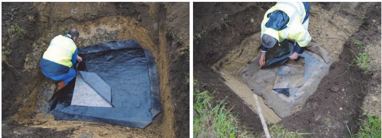
Figure 12. Prélèvement des échantillons de géomembrane EPDM