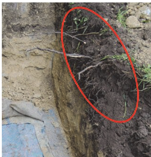
Figure 16. Pied du dôme – Localisation de la zone racinaire