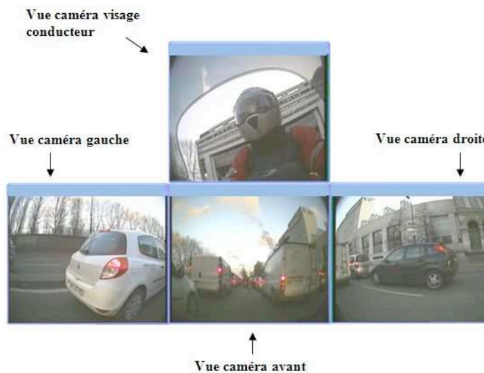
Figure 2 : Mise en forme des vidéos pour la tenue des entretiens

Une mise en forme des données vidéo a été réalisée afin de permettre la tenue des entretiens. Cette mise en forme consiste à un positionnement des quatre vues afin d'être au plus près du contexte de trafic rencontré par le motard (Figure 2).