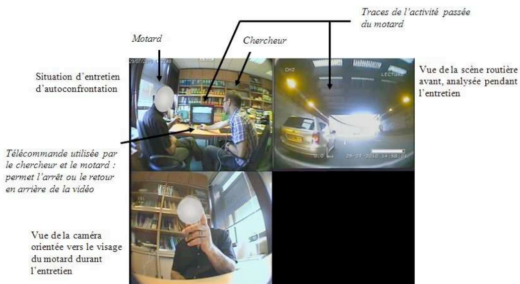
Figure 3 : Exemple d'une situation d'entretien d'auto-confrontation présentant la disposition des acteurs (motard/chercheur) et le matériel utilisé

comportement du motard et d'entretiens centrés sur l'explicitation « pas à pas » de son expérience offre des perspectives intéressantes pour l'étude de l'activité réelle de conduite intégrant le point de vue du motocycliste. Des épisodes vidéo de remontées de files recueillis en session de conduite sont projetés au motard (telles que présentées dans la Figure 3) qui les commente avec l'aide du chercheur. Les relances sont « centrées » sur l'action, afin que le motard puisse se replacer dans le contexte dynamique de la situation vécue. Les données collectées sont enregistrées avec le même matériel qui est utilisé pour recueillir les vidéos avec les véhicules instrumentés. Chaque entretien correspond à l'étude d'un trajet d'un motard (un déplacement « domicile/travail » par exemple) qui intègre de la circulation entre files et qui se déroule dans les trois jours précédant l'entretien (datation jugée suffisamment proche de l'entretien pour un niveau acceptable de mémorisation après plusieurs essais). La tenue des entretiens a été dépendante du bon enregistrement des vidéos. 31 entretiens ont été effectués (pour une durée totale de 13 h 30), ce qui correspond à deux ou trois entretiens par participant selon la quantité de vidéos recueillies. La durée moyenne de ces entretiens est de 25 minutes.