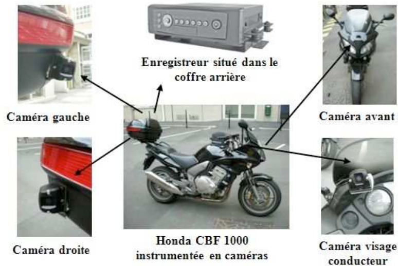
Figure 1 : Emplacement des quatre caméras embarquées et de l'enregistreur sur le véhicule équipé

L'analyse se centre sur ces trajets enregistrés, ce qui correspond à 85 heures de vidéo.