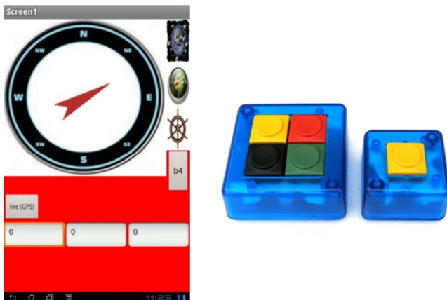
Fig. 5. Prototype d'IHM et claviers permettant la navigation

- Les risques environnementaux d'une telle solution évoluant en milieu marin. En effet, quelques précautions sont à prendre afin de limiter les risques spécifiques liés à cet environnement, particulièrement hostile pour tous appareils électriques. Ces précautions passent par l'étanchéité du boîtier et du téléphone et de tous les câbles de liaisons entre capteurs et actionneurs. La communication sans fil entre les appareils a été privilégiée afin de limiter le nombre de câbles présents. Enfin, l'ensemble du dispositif devra être respectueux de l'environnement marin.