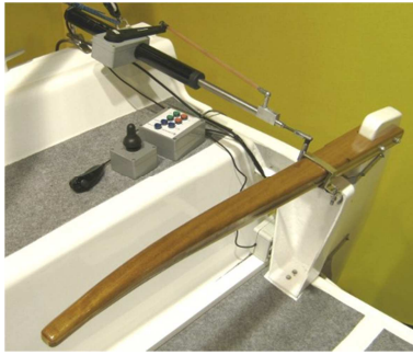
Fig. 3. Présentation du dispositif Splashelec

Ce boîtier central a été développé en se basant sur la technologie open-source , ceci afin de pourvoir adapter librement et facilement de nouvelles fonctionnalités, comme cela est nécessaire avec les problématiques très hétérogènes du handicap. Le résultat de cette initiative open-source (matériel et logiciel) est disponible sur Internet [7].