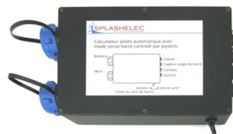
Fig. 2. Boîtier calculateur du système

Le boîtier électronique (figure 2) au cœur du système est un vrai calculateur de pilote automatique. Il contient un microcontrôleur, l'électronique de puissance pour un vérin électrique ou une pompe hydraulique, les circuits d'alimentation et divers interfaces pour le capteur d'angle de barre, le joystick, un petit clavier de commande et un bus de communication (voir figure 3).