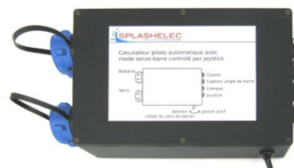
Fig. 2. Boîtier calculateur du système

Le boîtier électronique (figure 2) au cœur du système est un vrai calculateur de pilote automatique. Il contient un microcontrôleur, l'électronique de puissance pour un vérin électrique ou une pompe hydraulique, les circuits d'alimentation et divers interfaces pour le capteur d'angle de barre, le joystick, un petit clavier de commande et un bus de communication (voir figure 3).