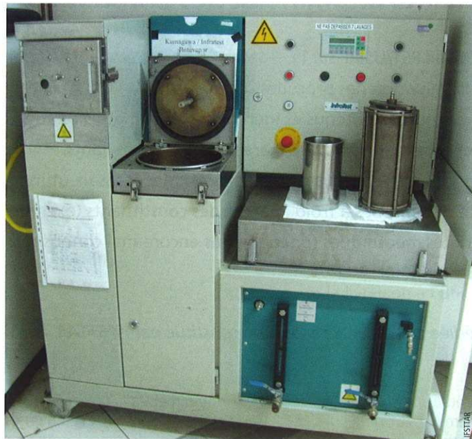
Photo 1 Dispositif d'extraction type Infracast Infracast - binder recovery equipment