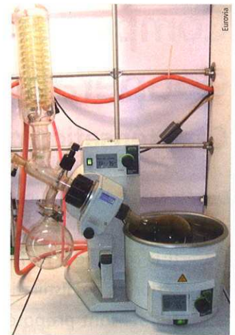
Photo 4 Dispositif de distillation par évaporateur rotatif Rotary evaporator - binder recovery equipment

Après l'extraction du liant de l'enrobé, il convient de récupérer le liant, en solution dans le solvant d'extraction, pour entamer sa caractérisation. Pour cette étape, comme pour la précédente, c'est une norme dédiée aux enrobés à chaud qui est pratiquée : NF EN 12697-3 [9] (photo 4) avec des limites techniques qu'il convient également d'identifier, notamment quand le liant bitumineux contient des fluxants potentiellement extractibles du mélange en même temps que le solvant.