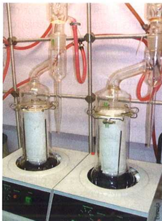
Photo 2 Dispositif d'extraction type Kumagawa Kumagawa - binder recovery equipment

Après l'extraction du liant de l'enrobé, il convient de récupérer le liant, en solution dans le solvant d'extraction, pour entamer sa caractérisation. Pour cette étape, comme pour la précédente, c'est une norme dédiée aux enrobés à chaud qui est pratiquée : NF EN 12697-3 [9] (photo 4) avec des limites techniques qu'il convient également d'identifier, notamment quand le liant bitumineux contient des fluxants potentiellement extractibles du mélange en même temps que le solvant.