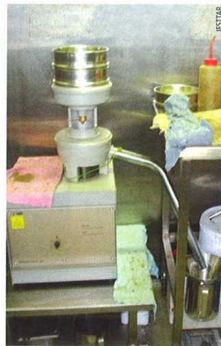
Photo 3 Dispositif d'extraction type SMM SMM - binder recovery equipment

A l'exclusion de la méthode exploitant la distillation azéotropique, toutes les autres méthodes nécessitent un séchage préalable de l'enrobé à l'émulsion afin d'éliminer l'eau et permettre ainsi le dosage en liant. Cette étape de séchage, peu contraignante pour les enrobés à chaud (sous réserve de ne pas faire sécher l'enrobé à une trop haute température ou pendant un temps trop long), entraînera dans le cas des enrobés à l'émulsion, selon les formules, une évaporation d'une partie du fluxant volatil. Les conditions de séchage (température de l'essai, temps de séchage) sont donc susceptibles de générer des modifications des propriétés du liant au jeune âge et de fausser les conclusions.