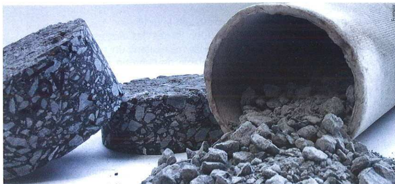
Extraction du liant d'un enrobé par le procédé Kumagawa Binder recovery from a mix by the Kumagawa process

Franck Le Cunff Chargé d'études Unité route durable et économe Laboratoire régional de Saint-Brieuc CETE de l'Ouest