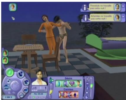
« Embrasser amoureusement »