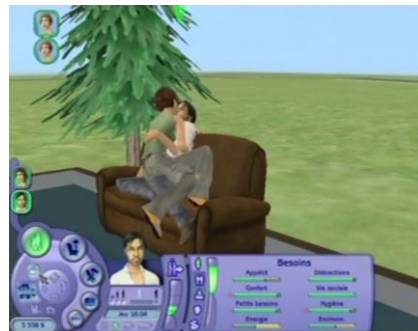
« Faire un câlin »

Au dessus des personnages apparaissent parfois différents symboles : des silhouettes qui se tiennent par la main, des petits "+", des petits coeurs. Jusqu'à ce que l'ordinateur vous propose enfin de « faire un câlin ».