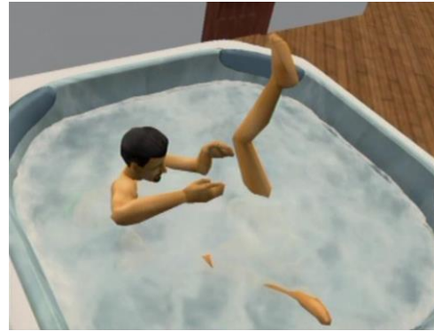
Faire “crac-crac”... dans un bain à remous,