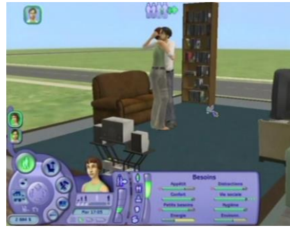
« Enlacer »