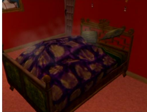
... dans un lit double,