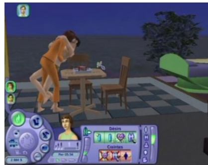
« Embrasser langoureusement »

Au dessus des personnages apparaissent parfois différents symboles : des silhouettes qui se tiennent par la main, des petits "+", des petits coeurs. Jusqu'à ce que l'ordinateur vous propose enfin de « faire un câlin ».