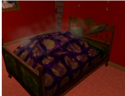
... dans un lit double,