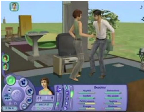
« Danser avec »

La séduction chez les Sims est très codifiée. Il y a des étapes obligées qui doivent être franchies en un certain ordre. Avant d'avoir le droit d'embrasser, il faut draguer, danser avec, enlacer... Difficile d'être original si on veut parvenir à ses fins ! La gestuelle aussi des personnages est très convenue. Mais, et cela est remarquable, hommes et femmes se comportent à l'identique.