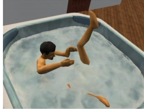
Faire “crac-crac”... dans un bain à remous,