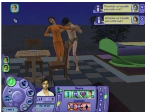
« Embrasser amoureusement »