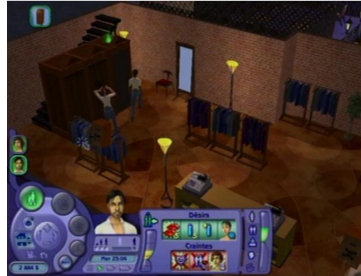
... dans une cabine d’essayage.

S’il est difficile dans ces moments de se méprendre sur l’activité des Sims, rien pourtant n’est montré. Dans le bain à remous, personne ne quitte son maillot. Dans le lit, l’action se passe toute entière sous les couvertures. Dans le magasin, le rideau reste tiré.