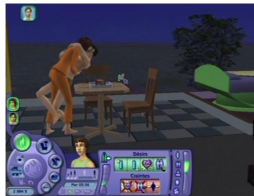
« Embrasser langoureusement »

Au dessus des personnages apparaissent parfois différents symboles : des silhouettes qui se tiennent par la main, des petits "+", des petits coeurs. Jusqu'à ce que l'ordinateur vous propose enfin de « faire un câlin ».