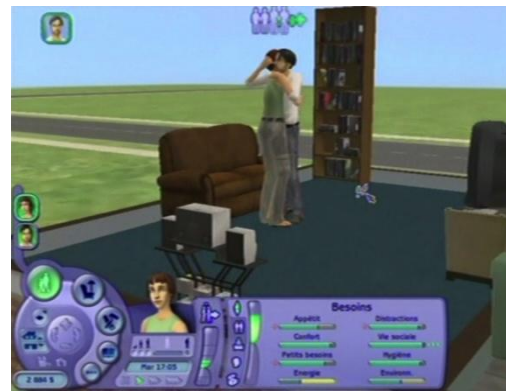
« Enlacer »