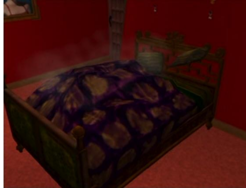
... dans un lit double,