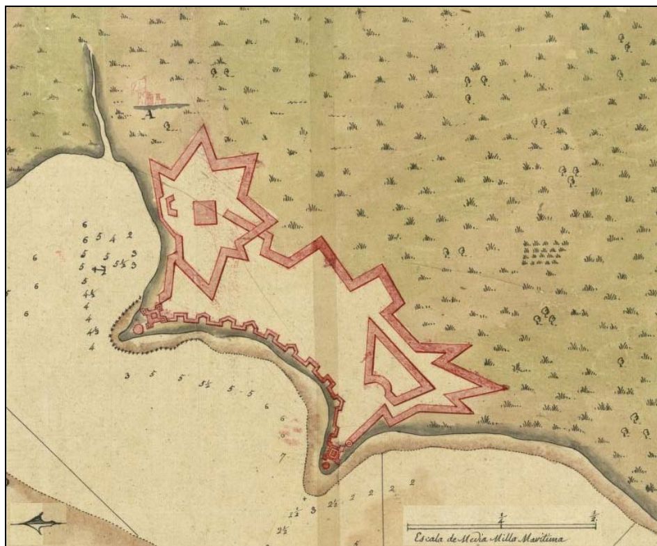
Figure 4 - Détail de la carte de Larache levée par Diego NOBLE en 1774.

il s'agit de terres de labour et de pacage, en particulier les zones où la nappe phréatique est à fleur de sol, et où l'herbe manque rarement, même pendant l'été, ce qui en fait d'excellents terrains pour le pâturage.