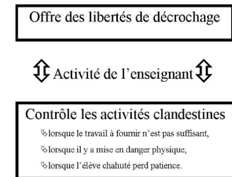
Figure 2: activité intentionnelle de l'enseignant