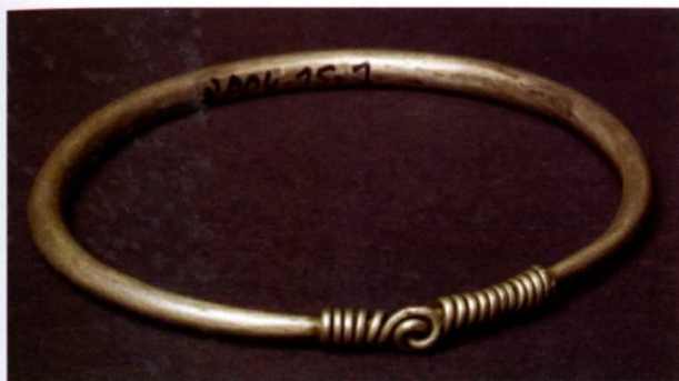
Fig. 2. - Bracelet en argent au système de fermeture comparable à deux bagues d'origine scandinave.

Largeur : 6,5 à 6,75 cm ; diamètre du jonc de section légèrement polygonal, creux semble-t-il : 0,2 à 0,5 cm ; longueur fermeture spiralée : 2,5 cm, se décomposant en 11 spires - les fils des 2 spires noué (entrelacé) - 5 spire.