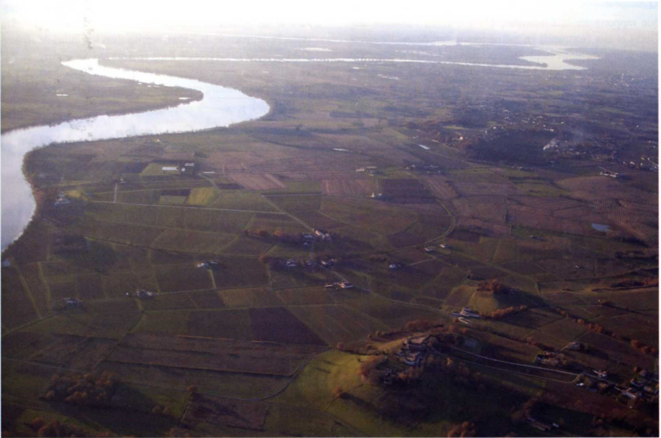
Fig. 4. - Vue aérienne de l'Ile-du-Carney (Lugon-et-l'Ile-du-Carney, ca. Fronsac, ar. Libourne).

La chronique de Guîtres fait deux allusions à des combats menés par les Normands. La première, placée dans la première partie de la Chronique , rapporte qu'après la mort d'Eudon « les Goths et les Normands arrivant à Guîtres, par mer et par terre, livrent entièrement cet oppidum aux flammes et le réduisent en une vaste solitude » 66 . La seconde, insérée dans la troisième partie de la Chronique , est plus détaillée. C'est une digression à propos d'une île donnée à l'abbaye de Guîtres par les vicomtes de Fronsac Grimoard et Raimond pendant le règne de Robert le Pieux :