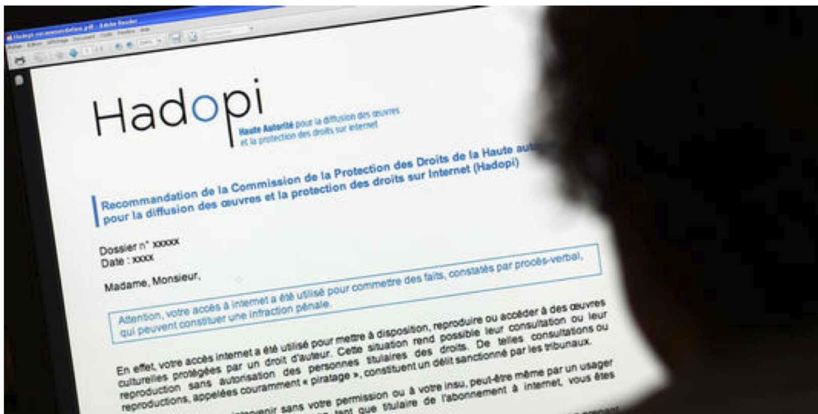
Un internaute consulte le site de la Hadopi.

Le Monde.fr avec AFP | 09.07.2013 à 02h31 • Mis à jour le 09.07.2013 à 08h26