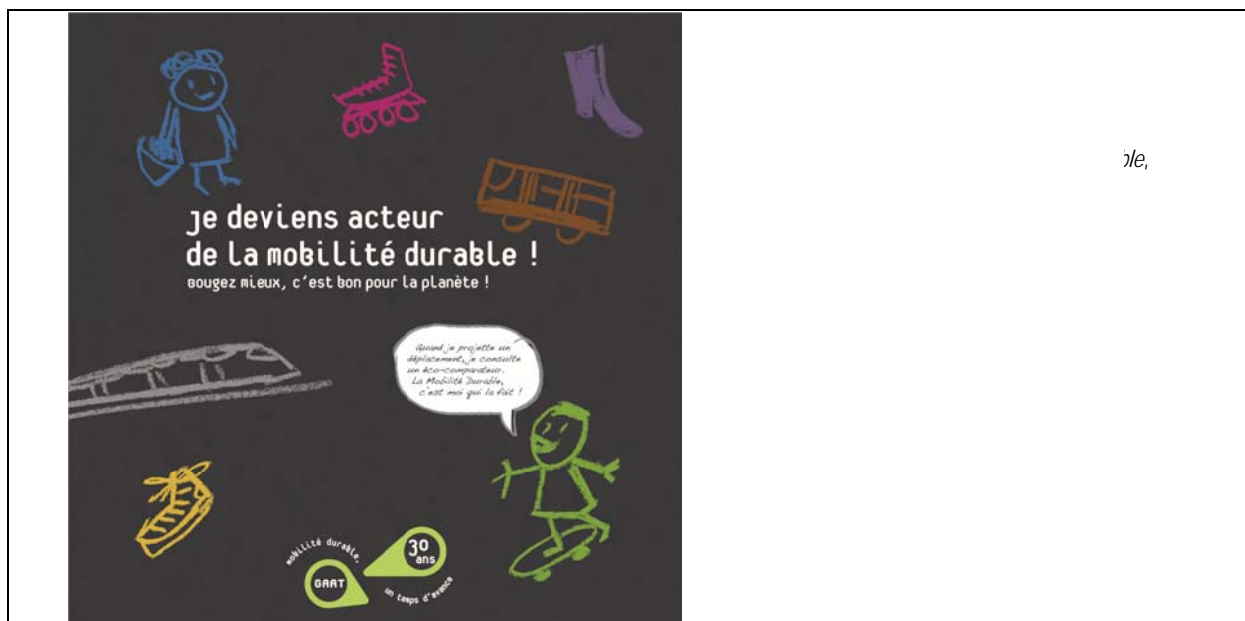
Figure 2. La mise en avant de la responsabilité individuelle dans le cadrage des enjeux de mobilité durable

On sait que l'organisation des activités sur le territoire laisse peu de marges de manœuvre à des individus (notamment à ceux, nombreux, qui ne résident pas dans le cœur des villes) dépendants d'un système automobile qui a façonné la ville et les modes de vie contemporains et qui exerce un monopole radical par rapport aux autres modes de déplacements (Dupuy, 2006) ; on sait aussi que la mobilité est en passe de devenir un enjeu social crucial (Orfeuill, 2010), que le capital mobilitaire pour tirer le meilleur avantage de la ville des flux tend à être de plus en plus discriminant (Kaufman, 2001), que la fragmentation des territoires de la vie quotidienne (qui implique de parcourir des distances croissantes) et celle du travail (temps partiel non choisi, intérim, contrats précaires, horaires décalés) font des enjeux de mobilité et d'accessibilité des dimensions structurantes de l'insertion sociale (Le Breton, 2005). Mais ces considérations n'ont pas leur place dans le cadrage dépolitisé des enjeux.