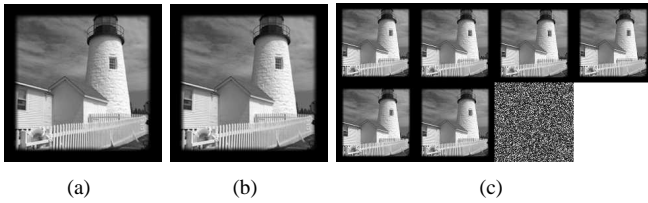
FIGURE 2 – interpolation SR L^1 pour M = 2 and N = 7 avec une image contaminée (a) image HR (b) image reconstruite (c) images BR (outliers sur la dernière image)

Le terme \|(A_{T_c}^H A_{T_c})^{-1}\|_1 ne peut pas être borné sans hypothèse sur les mouvements. On sait qu’en moyenne (A_{T_c}^H A_{T_c})^{-1} \sim \frac{1}{N} I [6] lorsque le support T est fixé et N \rightarrow \infty . De plus on peut estimer numériquement les constantes. Asymptotiquement, la contrainte devient N_c < C_4 N (pour R = 200 , on a C_4 = 60 ). Ce qui est bien mieux que le résultat précédent (l’équation (19)) ou la constante aurait valu 97000 pour R = 200 . La constante C_4 reste grande pour des cas pratiques, mais on sait qu’elle ne peut être inférieure à 2 [9]. On a utilisé un algorithme de moindres carrés itératif pondéré pour minimiser la norme L^1 [10, 9]. La Figure 1 montre une évaluation expérimentale du nombre d’images nécessaires pour une reconstruction parfaite lorsque K images sont contaminées. Pour chaque K, N , on calcule le PSNR ( peak signal-to-noise ratio , le rapport signal sur bruit en decibels normalisé par l’amplitude maximale de la référence) pour le résultat de 30 expériences avec différents mouvements. On montre le 10-ème centile (90% des reconstructions ont un meilleur PSNR). Dans la Figure 2, on insère une image LR composée de la valeur absolue d’un bruit gaussien de variance 125 (les pixels ont des valeurs dans [0, 255] ). Dans ce cas, 6 images non bruitées de plus donnent une reconstruction parfaite de l’image de haute résolution.