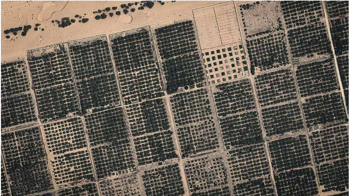
Photo 2. Vue satellite de la palmeraie moderne d'Ibn Chabbat et ses dattiers deglet nūr