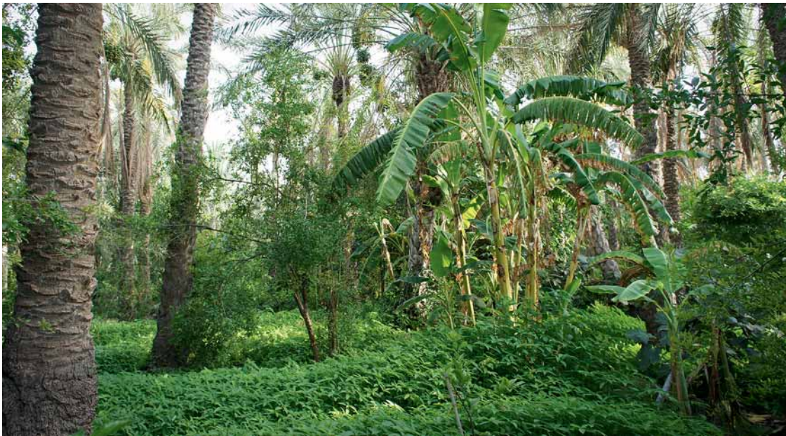
Photo 1. Dans la vieille palmeraie de Tozeur, cultivars de dattiers, bananiers, grenadiers, figuiers, citrus, abricotiers et corètes potagères