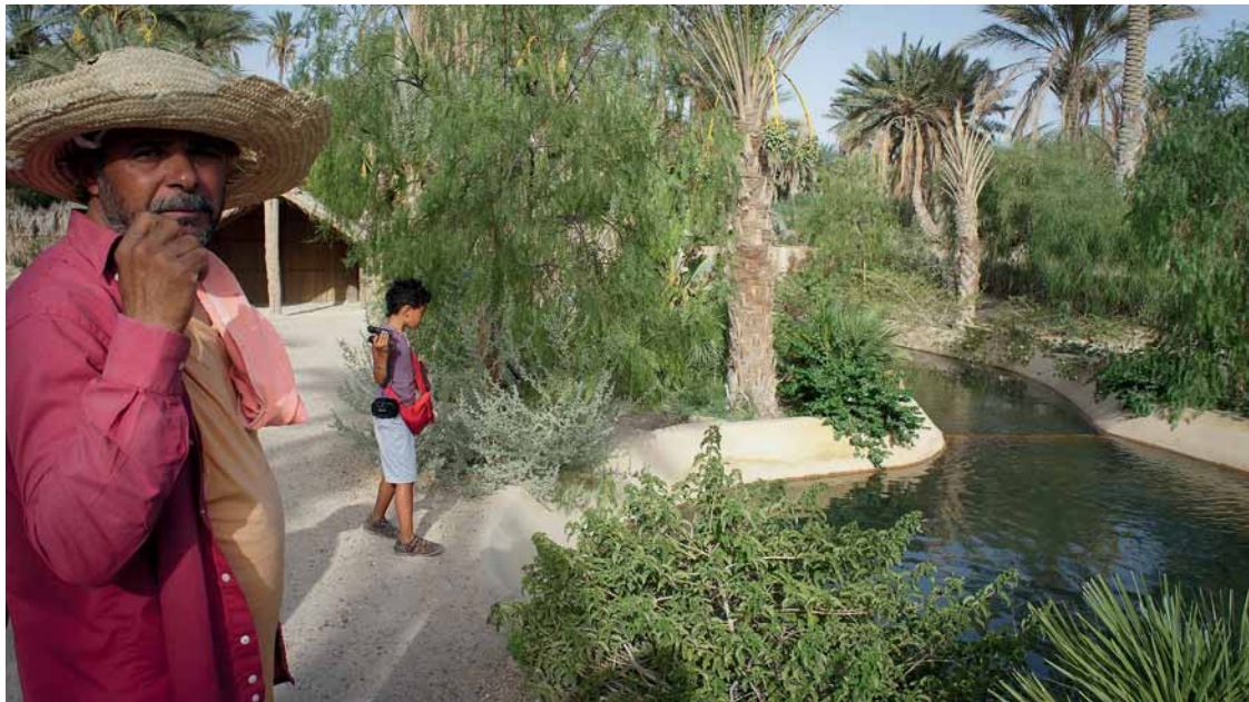
Photo 3. Sur le chemin d'une eau pour le tourisme : Corbeille de Nefta