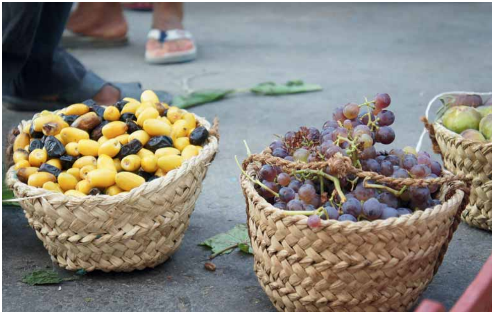
Photo 4. Raisins, figes et dattes précoces vendus directement au marché informel le soir, au retour du jardin