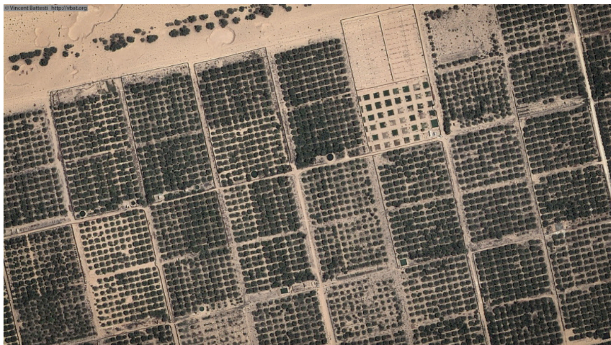
Figure 3 : Vue satellite de la palmeraie moderne d'Ibn Chabbat et ses dattiers deglet nûr alignés (2012).

puis abandonnés. Les autorités tenteront de convaincre les propriétaires locaux du bien-fondé d'une réforme des jardins, sur le contenu comme sur la forme. Des primes à l'arrachage des palmiers dits « communs » (tout ceux qui ne sont pas du cultivar deglet nûr ) et des incitations à simplifier ces jardins n'ont eut aucun résultats tangibles — d'où l'impression tenace d'une irréductible résistance au progrès et à l'entendement de la paysannerie locale. Ces autorités n'auront sans doute jamais bien saisi le statut des jardins de vieille palmeraie. Le jardin est une terre héritée de ses pères, qui produit certes, qu'on juge notamment sur sa production, la quantifiant même, mais sans en référer au rendement, car une part — et pas la moindre — de sa production est sociale, espace de sociabilités et d'expression d'une certaine esthétique [Battesti 2005].