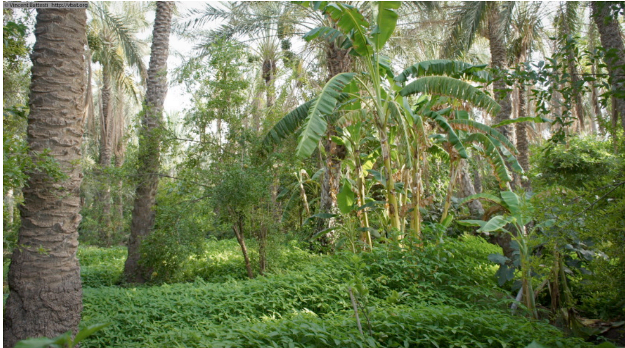
Figure 1 : Dans la vieille palmeraie de Tozeur, cultivars de dattier, bananiers, grenadier, figuier, citrus, abricotier et corète potagère (6 août 2011).

vie oasienne : l'eau, la terre, le matériel végétal. Le bilan, nous le verrons, est contrasté : l'annexion du local par l'État est une réalité finalement assez classique, surtout dans un contexte politique fortement jacobin, mais elle ne s'impose pas à toutes les ressources et pas toujours de façon exemplaire. Hormis peut-être pour l'eau, pointée très tôt comme le levier à tenir pour contrôler ces oasis [Battesti 2012]. En élargissant l'acception de « ressource », par la mobilisation de la notion de « ressources socioécologiques », nous aurons à bousculer quelque peu notre acception de l'appropriation, qui ne sera plus alors toujours l'œuvre des acteurs dominants du jeu local. Après avoir brièvement introduit la notion de ressources socioécologiques et présenté oasis et palmeraies du Jérid, nous nous intéresserons à l'eau, à la terre et aux gènes pour éclairer différentes manières d'appropriation de ressources.