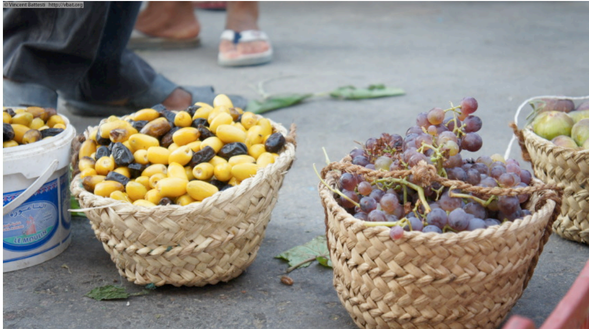
Figure 7 : Raisins, figes et dattes précoces — cultivar 'ammari — vendus directement par les agriculteurs au marché informel le soir au retour du jardin, à Tozeur (6 août 2011).

surprenant, à mon sens, est l'idée des ingénieurs agronomes d'avoir à repartir en mission pour convertir les jardiniers locaux à ces nouveaux bienfaits de l'agrobiodiversité, quand ces derniers ont su résister à des décennies d'injonction à la monoculture de deglet nûr de cette même administration. Si cette résistance a duré, c'est que cette passion collectionneuse répondait à une toute autre conception de l'agriculture, qui fait toujours sens, à côté d'une agriculture moderne.