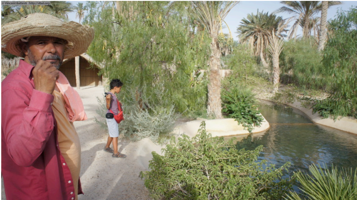
Figure 4 : Sur le nouveau chemin d'une eau pour le tourisme, Corbeille de Nefta (août 2011).

De nouveaux périmètres sont donc sortis de terre, allotés en parcelles d'1 ou 2 ha selon les projets, pour les agriculteurs nécessiteux, les clients du régime, les Bédouins sédentarisés, tous contraints par une supervision ingénieriale dans la conduite de leur projet agricole. Une autre partie de ces nouveaux périmètres irrigués, près de 650 ha qui était exploitée par la SODAD 10 , a été privatisée dans les années 2000, une fois leur rentabilité assurée, sous forme de lots pour techniciens et jeunes agriculteurs (250 ha) ou au profit de sociétés de mise en valeur et de développement agricole (400 ha) en quatre lots à Sdeda, el-Hamma, Mrah Lahouar et Nefta. Avec la révolution, le mécontentement s'est concentré sur cette catégorie de palmeraies modernes, car l'opinion publique dit les terres avoir été octroyées aux riches familles proches du pouvoir (en fait en location sur une quinzaine d'années) : elles ont aussitôt fait l'objet de réappropriations populaires. Ces quatre grands périmètres irrigués de la région étaient toujours occupés en juillet 2012.