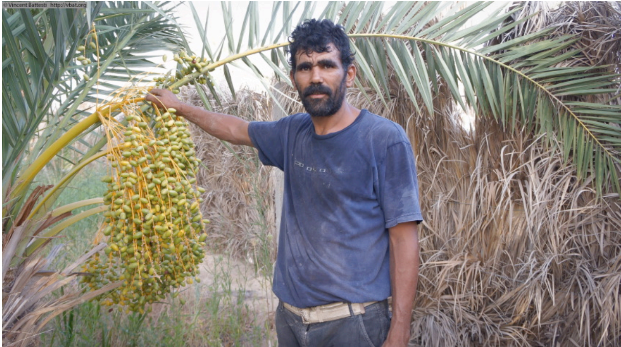
Figure 6 : Un khammes (métayer) en plein été en palmeraie ancienne de Tozeur (28 juillet 2011).

doute aussi grâce au discret lobbying de réseaux d'ONG. Les agents de l'État s'essaient donc à promouvoir la biodiversité :