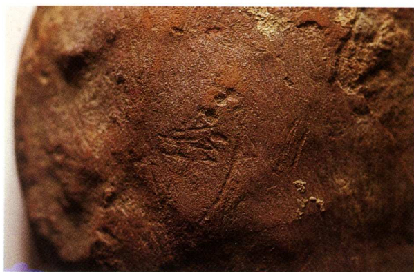
Fig. 3.- Detalle de la cabeza de caballo.

La de Altamira fue publicada por H. Alcalde del Río en 1906 8 , con la siguiente descripción: "...es sencillamente un pedazo de ocre rojo presentado por su cara superior; la posterior contiene una figura rectangular en línea gruesa. Este objeto carece de inmediata aplicación práctica. /.../ La figura n.º 10, de fina línea, aunque incierto y poco concretado su dibujo, es de apreciarse en él esta misma tendencia de que hemos hablado". Se refiere a una serie de trazos verticales separados en la base y unidos en las extremidades