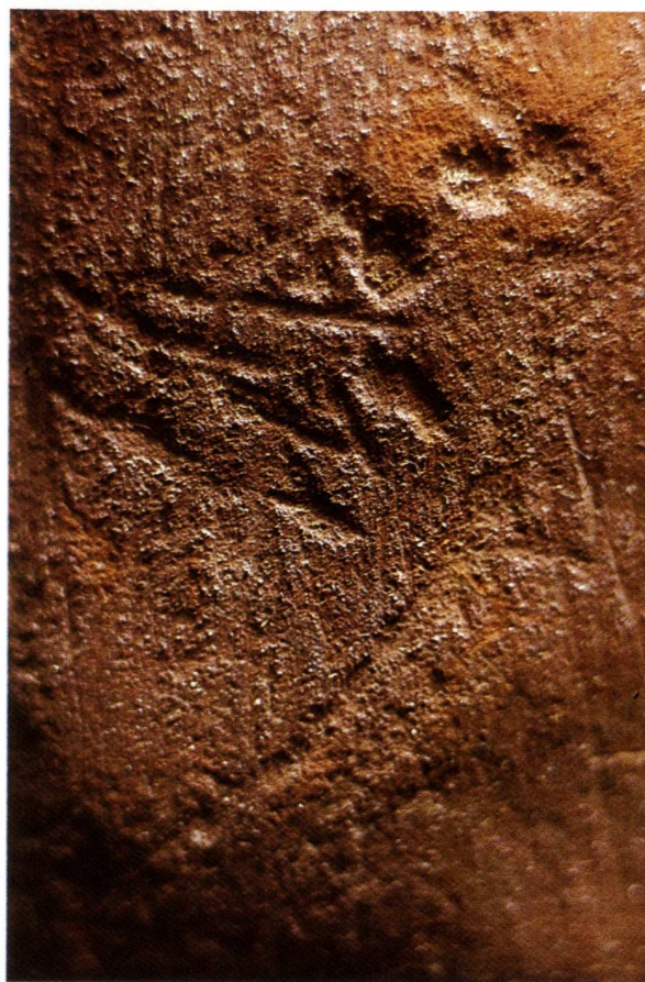
Fig. 4.- Detalle de la cabeza de caballo.

Así mismo, la plaquita de Urtiaga con indudables señales de utilización por frotamiento, tiene una "sencilla representación de caballo, incompletas sus patas y cabeza".