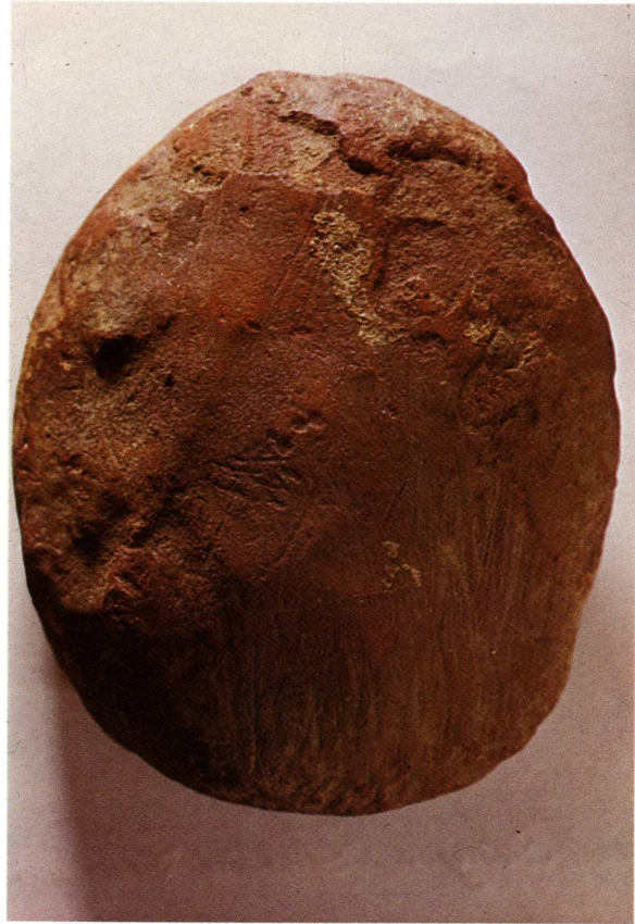
Fig. 2.- Cara superior del disco de ocre de la Chora.

De los escasos rebecos representados en arte