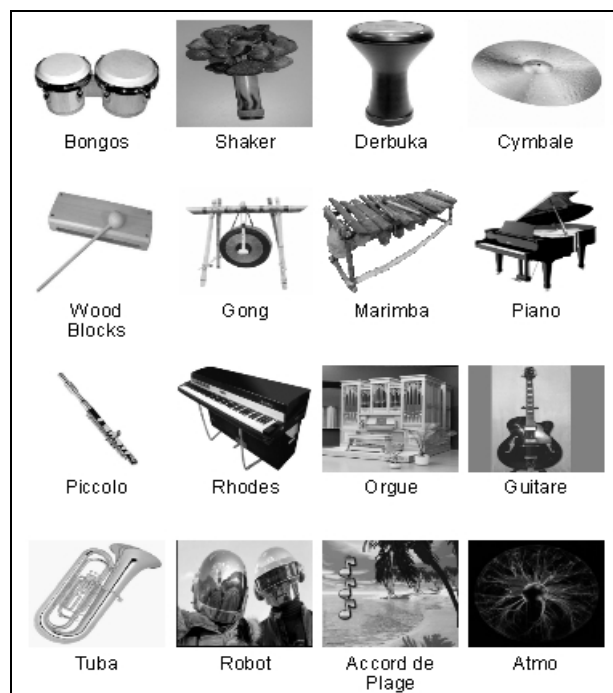
Fig 2 : Page « Wii » du catalogue des instruments

Nous avons donc choisi d'inclure pour la seconde version 6 instruments percussifs et 10 instruments mélodiques (donc 16 au total, un par canal MIDI). Comme il est très difficile de prévoir quel instrument attirera quel enfant, nous avons décidé de couvrir un spectre sonore aussi large que possible et d'observer les choix faits. La palette d'instruments proposée comporte donc aussi bien des instruments très communs (guitare, piano, congas, cymbales...) que des instruments plus « folkloriques » (woodblocks, gong...) voire purement synthétiques (robot, atmo...).