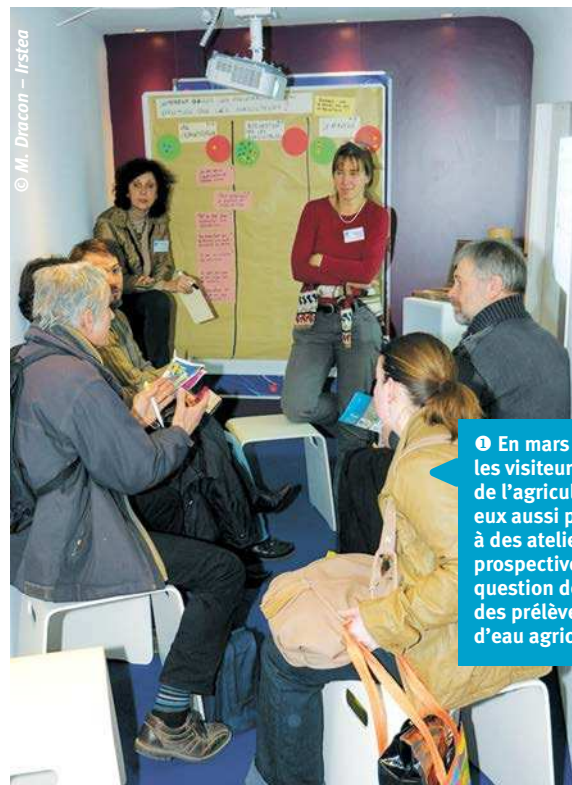
1 En mars 2012, les visiteurs du salon de l'agriculture ont pu aussi participer à des ateliers de prospective sur la question de la gestion des prélèvements d'eau agricole.

Concernant la prospective, notre démarche est de type exploratoire et non normative (pas de recherche d'une solution unique à promouvoir). D'un point de vue opérationnel, l'approche utilisée s'inspire du « scenario planning », une méthode qui consiste à projeter les acteurs dans un nombre limité de scénarios prédéfinis, au cours d'ateliers (pour une illustration, voir Hatzilacou et al. , 2007). Par rapport aux autres méthodes de prospective et notamment aux méthodes procédurales dans lesquelles les participants sont invités à construire eux-mêmes leur scénario, cette approche a l'intérêt de donner aux participants des éléments de référence construits qu'ils peuvent modifier et combiner. Elle présente aussi l'avantage de pouvoir être plus rapidement déployée dans des contextes où les acteurs ne seraient pas prêts à consacrer plusieurs jours à un exercice de prospective à long terme (ce qui est systématiquement le cas lorsque des chercheurs sont à l'origine de la démarche).