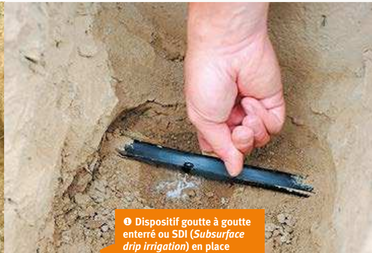
● Dispositif goutte à goutte enterré ou SDI ( Subsurface drip irrigation ) en place et goutteur d'une gaine souple en fonctionnement.

intégrale ou même le canon enrouleur, ce dernier est, en outre, beaucoup plus exigeant en termes d'énergie. En SDI, le risque d'apparition de mauvaises herbes est beaucoup plus faible qu'en aspersion.