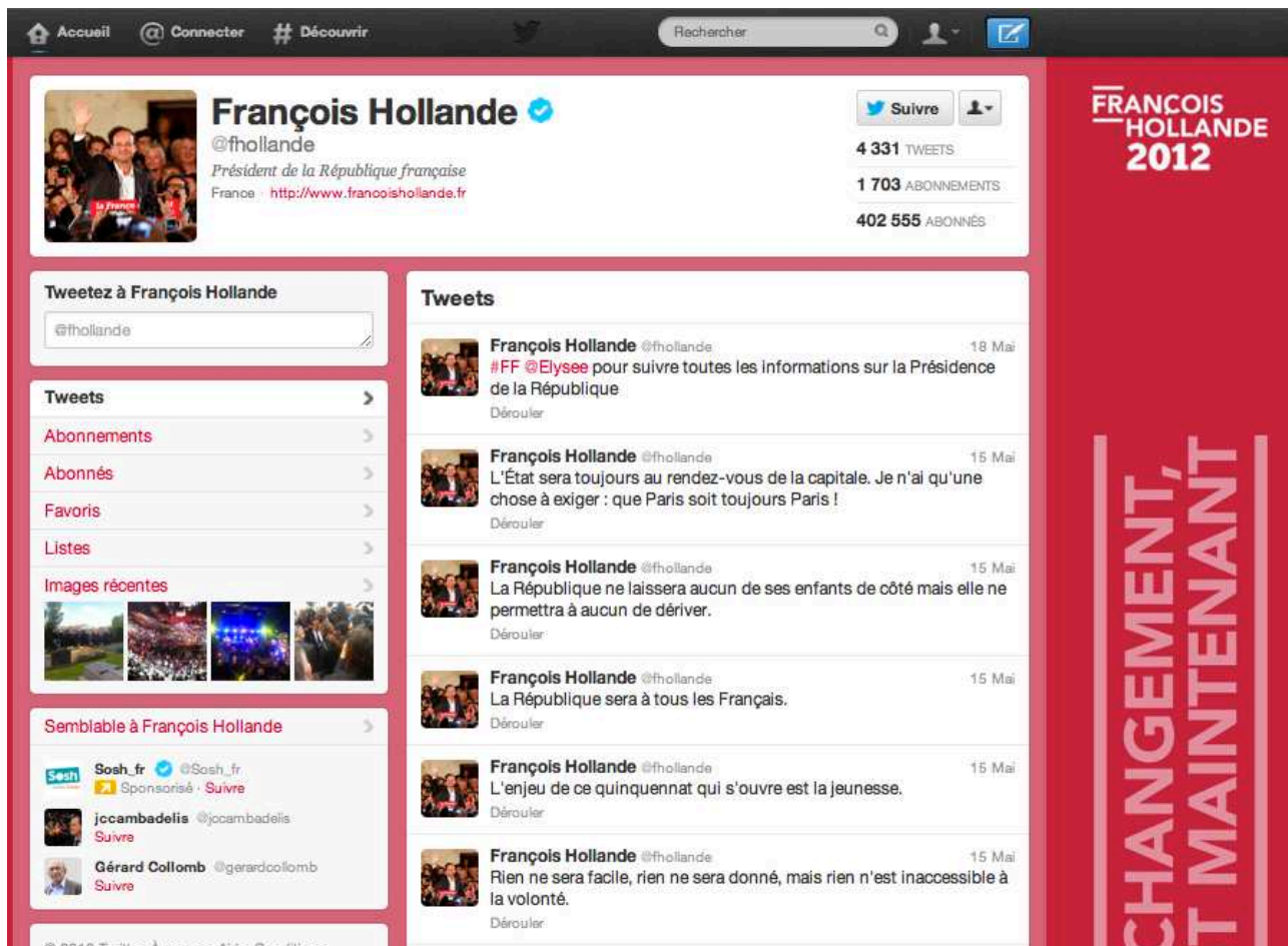
Illustration 1 : le compte de François Hollande

Le réseau de microblogging Twitter a été lancé en 2006, deux ans après le réseau social Facebook. Au départ, il devait permettre aux utilisateurs de décrire instantanément et brièvement ce qu'ils étaient en train de faire. Le slogan d'origine était en effet : « What are you doing ? » 11 . Le service est d'abord utilisé par l'intermédiaire des SMS (Short message service) sur les téléphones, qui n'autorisent que 160 caractères (blancs et ponctuation compris). Twitter en « prélève » 20 pour le nom d'utilisateur précédé de l'@ (le pseudo) et c'est ainsi que les fameux 140 caractères apparaissent. La contrainte est donc technologique au départ, puis elle est devenue une routine (il est techniquement possible d'augmenter le nombre de caractères sur Twitter et il existe par