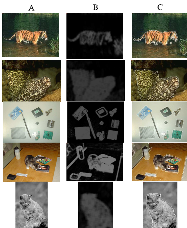
Figure 2 : Caractérisation de la texture par exploration de graphes de grandes dimension