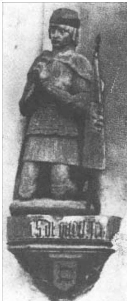
Planche 2. la statue de Diego López à Tolède. La présence de cet orant dans la cathédrale de Tolède fut mentionnée pour la première fois à la fin du XV e siècle. La statuette de pierre polychrome porte la légende "Diego Lopez seigneur de Biscaye", et représente le magnat avec l'étendard castillan reposant à son côté droit, qui rappelle la charge d'alférez. elle est accompagnée d'un écusson aux deux loups.

d'une culture avant tout orale dont peu d'œuvres ont subsisté.