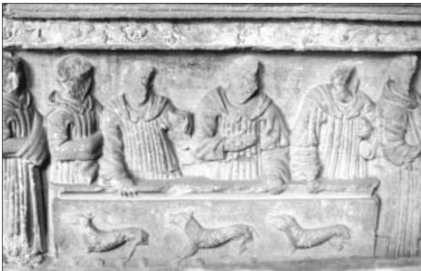
Planche 3B. Tombeau de Diego López, détail du relief.