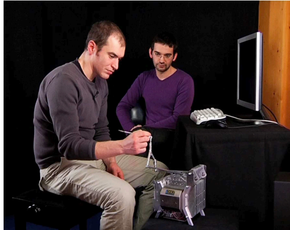
Figure 1. A gauche, interface à retour de force ERGON_X utilisée pour les expériences, équipée de l'habillage « joystick » de l'expérience n°1 ; le mouvement selon l'axe transversal (rouge) permet d'exciter la corde, le mouvement selon l'axe vertical (bleu) permet d'approcher ou d'éloigner l'archet de la corde et le mouvement selon l'axe longitudinal (gris) est libre, sans effet sur la simulation. A droite, vue d'ensemble du poste de jeu de l'expérience n°2 ; l'utilisateur tient dans sa main l'habillage « archet ».

Quatre simulations physiques différentes étaient proposées successivement : deux simulations réalisées avec le formalisme CORDIS-ANIMA [4] et deux simulations composées d'un modèle de corde réalisé à l'aide de la technique des guides d'onde et d'un modèle de frottement d'archet nommé DISTPLUCK [8]. Pour chacun de ces deux types de simulations, la différence entre les deux versions se situe au niveau de l'amortissement de la corde lorsqu'on la laisse vibrer après l'avoir excitée : une simulation présentait un