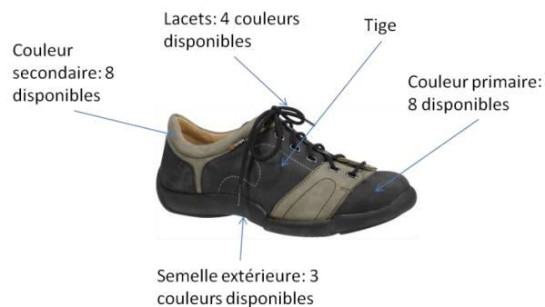
Figure 2: Chaussure Binom, combinaison gris-gris clair

Pour les chaussures d'hommes, cinq combinaisons de couleurs sont offertes actuellement : orange-gris, marron-marron clair, bleu-bleu clair, noir, gris-gris clair. La combinaison gris-gris clair est présentée dans la Figure 2. Dans le cadre de la MC, Alpina laisse son client choisir une couleur pour sa chaussure ou une combinaison de deux des huit couleurs existantes. De même, pour les chaussures femmes, huit combinaisons sont offertes : gris-orange, noir-gris, marron-violet, marron-marron clair, bleu-bleu clair, marron, noir, marron clair. Ainsi, dans le cadre de la MC, une cliente d'Alpina pourra choisir la couleur de sa chaussure ou une combinaison de deux couleurs parmi les neuf couleurs existantes.