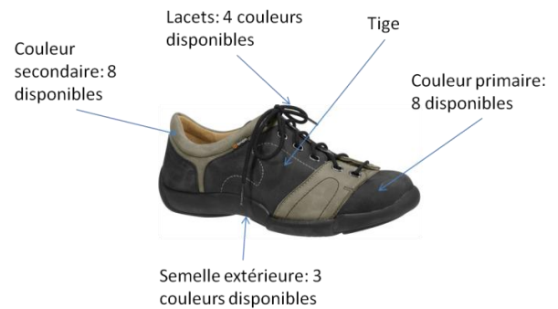
Figure 2: Chaussure Binom, combinaison gris-gris clair

Pour les chaussures d'hommes, cinq combinaisons de couleurs sont offertes actuellement : orange-gris, marron-marron clair, bleu-bleu clair, noir, gris-gris clair. La combinaison gris-gris clair est présentée dans la Figure 2. Dans le cadre de la MC, Alpina laisse son client choisir une couleur pour sa chaussure ou une combinaison de deux des huit couleurs existantes. De même, pour les chaussures femmes, huit combinaisons sont offertes : gris-orange, noir-gris, marron-violet, marron-marron clair, bleu-bleu clair, marron, noir, marron clair. Ainsi, dans le cadre de la MC, une cliente d'Alpina pourra choisir la couleur de sa chaussure ou une combinaison de deux couleurs parmi les neuf couleurs existantes.