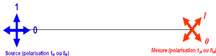
FIGURE 1. Source lumineuse pouvant émettre une lumière polarisée

même mesure sur l'autre photon doit être identique, même s'il est à l'autre bout de l'univers). Selon Einstein, ce phénomène ne peut être interprété qu'en considérant que les deux photons intriqués emportent avec eux le résultat futur de leur mesure commune, sous forme d'une variable cachée déterminée lors de leur émission. Ce résultat commun ne peut, toujours selon Einstein, être tiré au hasard au moment de la mesure de l'état d'un des photons, car comme il est possible de mesurer l'état de l'autre aussitôt après, de manière quasi-simultanée, et que le résultat doit être le même, cela impliquerait une interaction à distance instantanée. Or ce type d'action est contraire au sens commun, car revient à remettre en cause le fait que le monde puisse être décrit localement. L'argument donc, prouvait selon lui l'existence des variables cachées et donc l'incomplétude de la théorie quantique. En réalité comme on peut le voir, la seule chose qui est prouvée par l'argument EPR est que si le monde est local, alors les variables cachées existent. A ce stade l'histoire devient aussi passionnante qu'un roman à suspense : on doit à John Steward Bell l'invention d'une expérience réalisable dont les résultats sont différents selon qu'on les prédit en utilisant la stricte théorie quantique [6], ou en considérant que les variables cachées existent ! Nous en présentons ci-après une version totalement exacte bien que simplifiée :