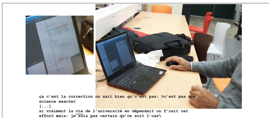
Figure 2 : Entretien d'explicitation de la correction

Dans les deux situations explorées, la catégorie 4 de « responsable de l'épreuve » est reconnue comme pertinente pour l'ensemble des correcteurs qui s'accordent à suivre les décisions et engagements pris. Cette prise de responsabilité est rendue visible à travers les réponses pour la prise de décision émanant spontanément du responsable dans l'échange. La catégorisation de l'enseignant en tant que responsable des corrections est également directement observable à travers les droits et obligations qu'il mobilise dans l'interaction. Ces droits et obligations sont invoqués en tant qu'arguments permettant de justifier certaines pratiques. L'énonciation de la règle « le jury est souverain » vient ainsi légitimer un ajout de point sur les corrections d'un des correcteurs qu'il estime « trop sévère » ; le « contrôle continu » est également invoqué pour préciser que la réalisation de l'anonymat n'est pas rendue obligatoire dans ce cas. Les justifications correspondent également à des choix stabilisés pour les enseignants. La position adoptée par l'un des correcteurs ayant eu recours à une évaluation globale sur sa question (sans critères intermédiaires) se manifeste en effet comme celle de membre du corps universitaire. Les arguments sont à la fois généralisés et objectivisés.