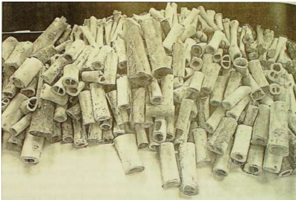
Photo 1 : le lot d'ossements d'animaux bruts de la collection P. Bragulat

Dans notre collection, la technique est invariable. L'os préalablement évidé reçoit la lanière qui le traverse. On enfonce ensuite des lamelles de bois, sortes de petits coins, qui viennent se loger dans la cavité de l'os sur toute sa longueur et qui ont pour but de coincer la lanière. Un exemplaire de la collection, en cours d'ébauche, montre parfaitement la technique à ce stade de fabrication.