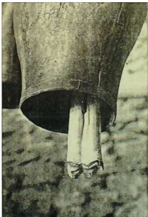
Photo 3: dent de cheval montée en battant sur une borromba

aller librement- et c'est la raison pour laquelle on taillait autrefois ces attaches, de préférence, dans les longues courroies qui servaient à lier les jougs aux cornes des bœufs ou des vaches de travail.