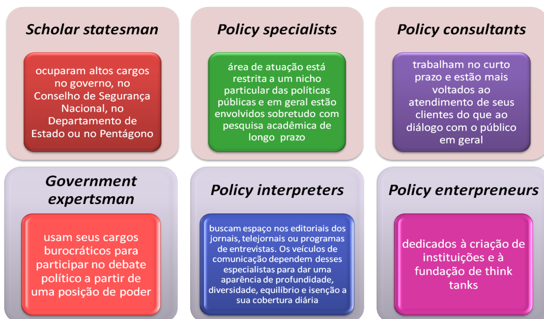
Figura 3: Perfil dos especialistas engajados nos think tanks (Smith, 1991)