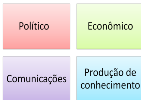
Figura 1: Campos de atuação dos think tanks (Medvetz, 2008)