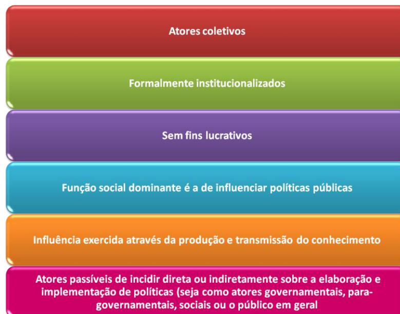
Quadro 1: Características dos think tanks (Acuña, 2009)