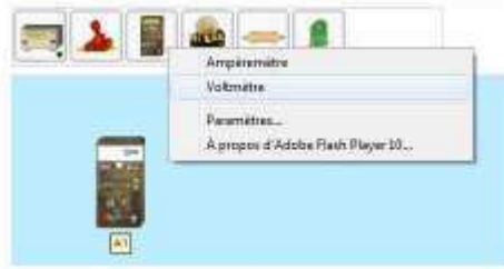
FIGURE 4 –Menu contextuel TPElec pour sélectionner certains composants

mauvais choix d'appareils de mesure. Ils devaient donc supprimer les appareils posés et les remplacer par les appareils corrects.