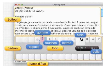
Figure 2. Chewing Word

Chewing Word [5] (Fig. 1) possède un principe qui diffère largement des précédents ; seules quelques lettres sont affichées simultanément, et s'agencent en fonction de la position du curseur lors de la dernière entrée. La saisie se fait par clic normal ou par clic long. La prédiction de mots est intégrée et dynamique, elle s'adapte au vocabulaire de l'utilisateur et il n'est même pas nécessaire de pointer le mot pour le valider, il suffit de faire un clic long sur la lettre. Le clavier virtuel demande de la concentration pour trouver la lettre voulue. Cela est dû au changement d'emplacement des lettres.