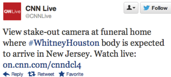
Figure 2. Exemple d'un Tweet issu de la collection INEX Tweet Contextualization pour l'année 2012.

La principale difficulté avec l'utilisation des hashtags vient du fait qu'ils sont pour la plupart composés de plusieurs mots concaténés. La figure 2 illustre ce problème avec le hashtag #WhitneyHouston. Dans ce cas précis, il ne serait pas possible pour un système de recherche d'information classique de renvoyer des documents liés à Whitney Houston étant donné que ces deux mots n'apparaissent pas dans le Tweet.