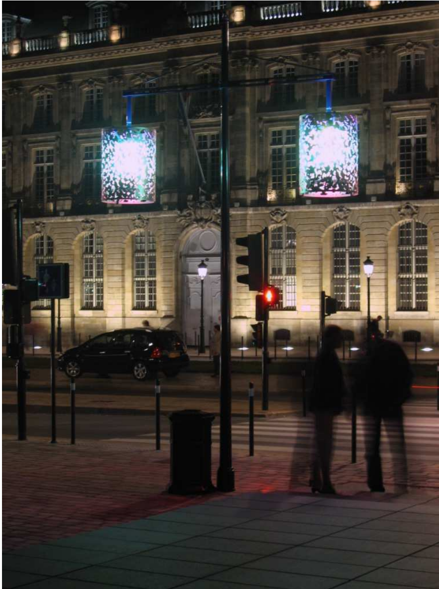
Sandra Mallet, septembre 2008

A travers ces trois mises en éclairage modernes et dynamiques de ces espaces exemplaires de la politique de la ville (car ayant bénéficié des changements urbanistiques les plus spectaculaires), la lumière, signe de renouveau, vient, conforter la démonstration de la capacité d'entreprise de la municipalité.