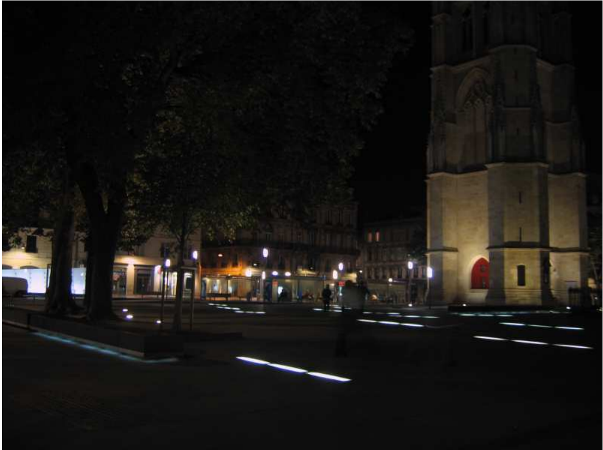
Sandra Mallet, septembre 2008

Troisièmement, les berges des quais centraux de la rive gauche inaugurés en mai 2009 possèdent un matériel d'éclairage singulier, offrant une lumière colorée et une ambiance festive. Sur 4,5 kilomètres, leurs aménagements constituent une sorte de « vitrine » de la transformation urbaine de la métropole bordelaise et sont inscrits au centre du projet de la ville. Ces aménagements s'inscrivent sur des espaces délaissés par les activités depuis plusieurs années et visent à intégrer les quais au sein des espaces publics bordelais. Les « quais jardinés » ont été aménagés par Michel Corajoud et mis en lumière par Laurent Fachard. Cette partie est illuminée par des sortes de « lampions » faits de tôle en acier inox à motif de feuillage qui offrent une lumière rose et verte. L'installation se double d'éclairages trichromatiques (rouges, verts et blancs) placés sur les boulevards, au niveau des placettes de la berge.