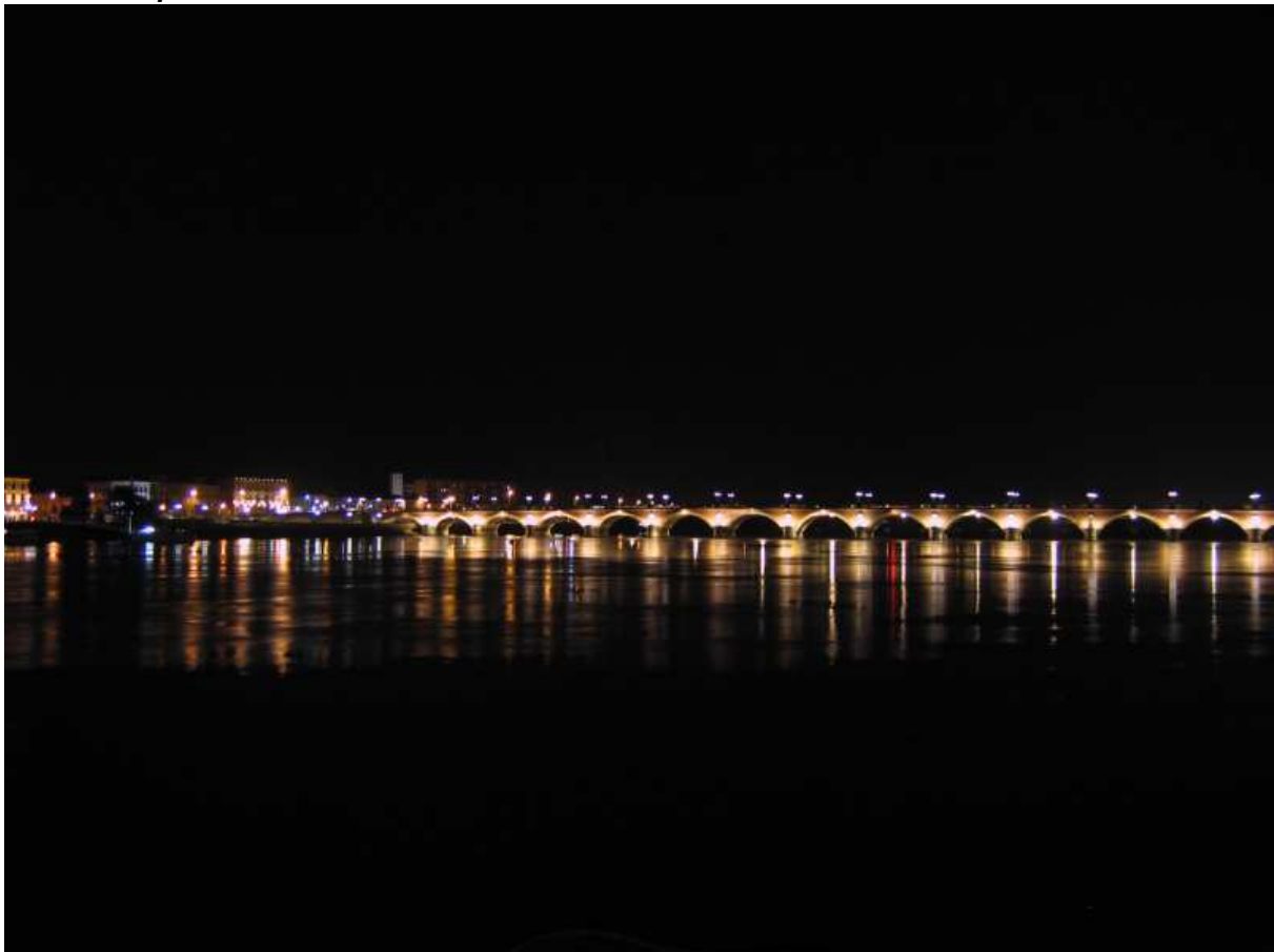
Sandra Mallet, septembre 2008

Les mises en lumière tiennent non seulement un rôle majeur dans l'annonce du PPU, mais seront aussi utilisées pour préfigurer d'autres aménagements urbains majeurs.