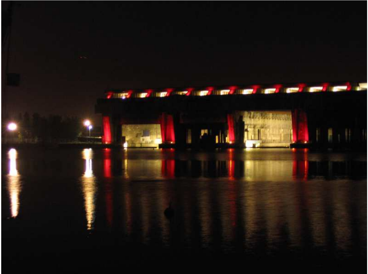
Sandra Mallet, avril 2005

La majorité de ces lieux et bâtiments n'avait jusque-là jamais bénéficié d'une mise en lumière spécifique. Par conséquent, les nouveaux éclairages mettent en valeur de façon inédite ces espaces et les dévoilent sous un autre aspect. Or éclairer ou ne pas éclairer résulte d'une décision politique : le rythme soutenu de ces mises en lumière, qui, pour la plupart se sont déroulées en 1995 et 2000, affirme la rupture politique avec l'ancienne municipalité. Les illuminations révèlent, en quelque sorte, une « nouvelle ville » qui s'est d'abord appuyée sur certains espaces pris comme témoins, avant de se diffuser dans l'ensemble de la ville.