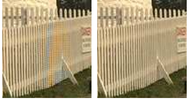
FIGURE 2 – Résultat du dématricage linéaire par sélection spectrale (voir section 4) sur une partie de l'image Lighthouse .