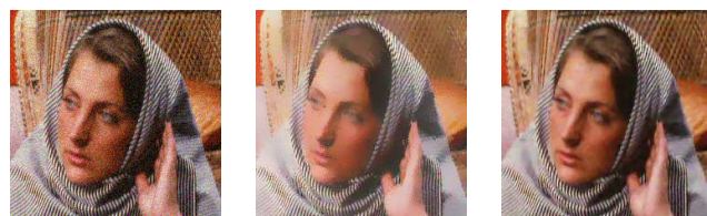
(a) Image couleur + bruit. (b) Filtrage bilatéral [19]. (c) EDP anisotrope [20].