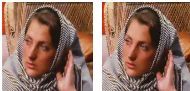
(d) Moyennes Non-Locales [5]. (e) Diffusion anisotrope par patch (4).