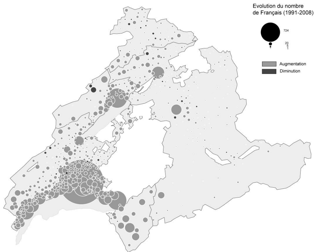
Figure 3 : Évolution du nombre de résidents de nationalité française, communes des cantons de Berne, Jura, Neuchâtel et Vaud (1991-2008) (Source : OFS, PETRA)

de-Fonds ont perdu respectivement 2 et 83 habitants par rapport à la France, ce qui est relativement négligeable étant donné la durée de la période considérée et la taille des villes). L'attrait des communes françaises limitrophes est ainsi compensé par des flux en sens inverse (sans qu'il soit possible de distinguer avec les données disponibles les mouvements selon les départements). La concurrence en termes de localisation résidentielle exercée par les communes françaises proches concerne davantage les travailleurs qui deviennent frontaliers après avoir décroché un emploi, alors qu'ils franchiraient peut-être la frontière si leur lieu de travail était plus éloigné.