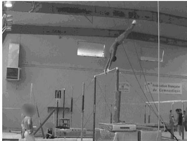
Figure 5 : L'entraîneur F précise au gymnaste ce qu'il doit faire au moment même où celui-ci agit : « Là... calme... pousse poitrine... »

Figure 5: The coach F indicate the gymnast what he must do at this time: "There... calms... pushes chest..."