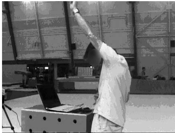
Figure 7 : L'entraîneur C indique au gymnaste les sensations à obtenir « sentir le menton sur la poitrine » ou « voir son nombril »

Entraîneur C : « Il faut que tu cherches à sentir ton menton sur la poitrine, ou à voir ton nombril ».