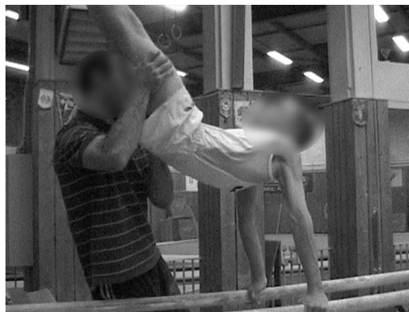
Figure 3 : L'entraîneur manipule le gymnaste pour lui faire voir et sentir ce qu'il doit faire lors de la réalisation d'une phase de placement aux barres parallèles

Figure 2: The coach shows with his hand what the gymnast must do at the time of the placement phase to parallel bars