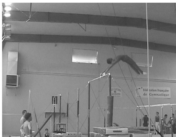
Figure 6 : « Arrêt sur image » vidéo pour lequel l'entraîneur F fournit des explications au gymnaste

Le deuxième contexte correspondait aux moments où les entraîneurs fournissaient des explications au gymnaste et cherchaient à dialoguer avec lui. Toujours à propos de l'exemple précédent, l'entraîneur F avait filmé le gymnaste et s'attardait avec lui sur un moment précis de la phase aérienne de l'habileté travaillée (Figure 6).