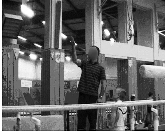
Figure 2 : L'entraîneur montre avec le bras ce que le gymnaste doit faire lors de la réalisation d'une phase de placement aux barres parallèles

Figure 2: The coach shows with his hand what the gymnast must do at the time of the placement phase to parallel bars