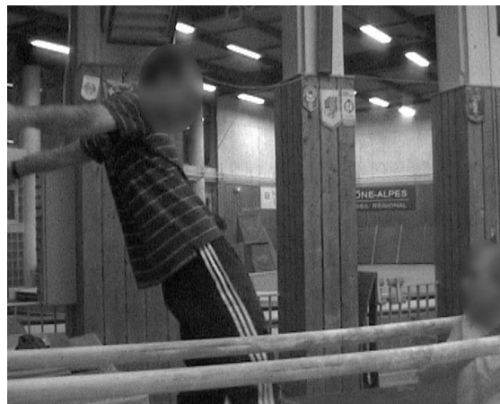
Figure 1 : L'entraîneur montre avec l'ensemble de son corps ce que le gymnaste doit faire lors de la réalisation d'une phase de placement aux barres parallèles

La référence que faisaient les entraîneurs à ces phases de placement sont apparues au fil des entraînements à différentes occasions : ils les dessinaient à la craie sur un tableau ou même sur un tapis ; ils les mimaient avec l'ensemble de leur corps (Figure 1), leurs bras et mains (Figure 2) ; ils les décrivaient verbalement ; ils manipulaient le gymnaste pour le placer précisément dans la position caractéristique de la phase concernée et lui faire ressentir certaines positions ou actions à réaliser (Figure 3) ; ils organisaient enfin des dispositifs matériels ad hoc pour faire travailler le gymnaste sur un aspect précis et localisé qui concernait la phase en question.