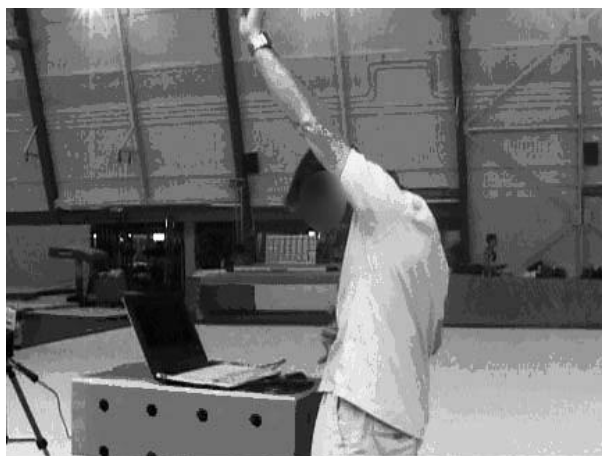
Figure 7 : L'entraîneur C indique au gymnaste les sensations à obtenir « sentir le menton sur la poitrine » ou « voir son nombril »

Entraîneur C : « Il faut que tu cherches à sentir ton menton sur la poitrine, ou à voir ton nombril ».