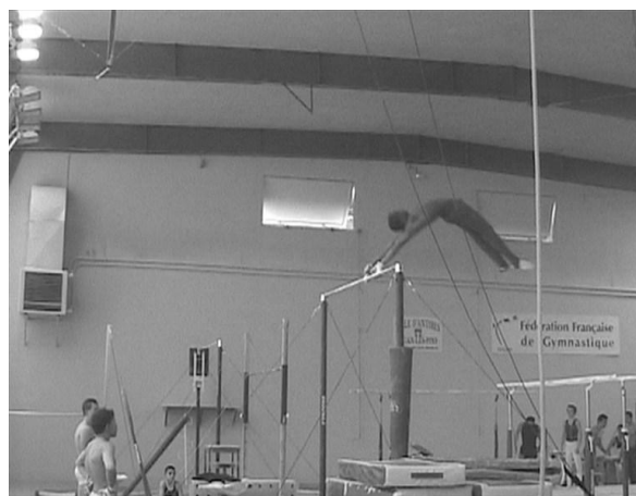
Figure 6 : « Arrêt sur image » vidéo pour lequel l'entraîneur F fournit des explications au gymnaste

Le deuxième contexte correspondait aux moments où les entraîneurs fournissaient des explications au gymnaste et cherchaient à dialoguer avec lui. Toujours à propos de l'exemple précédent, l'entraîneur F avait filmé le gymnaste et s'attardait avec lui sur un moment précis de la phase aérienne de l'habileté travaillée (Figure 6).