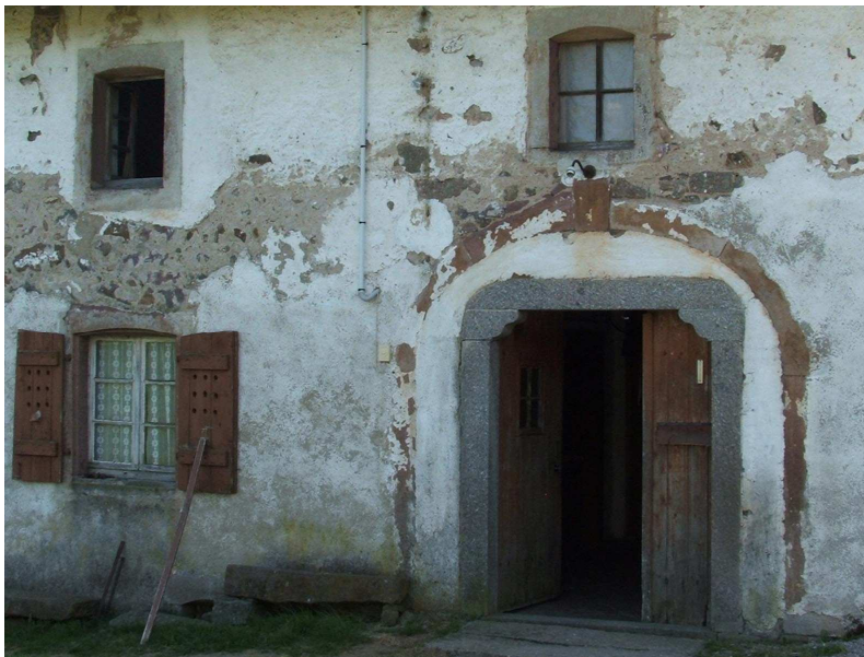
Photo 4 : La pierre pour lire l'histoire de la ferme.

Pour beaucoup, la pierre est la seule parure originale de la ferme. Ses murs en moellons, ses chaînages d'angle en pierre de taille, les linteaux et piédroits des portes et des fenêtres, la porte charretière sont les marqueurs visuels de la typologie de la ferme vosgienne. La pierre fait également référence aux procédés de construction, liés aux évolutions de la ferme, et qui permettent de lire son histoire (cf. photo 4).