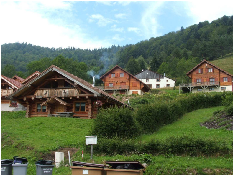
Photo 2 : Une standardisation qui s'imprègne

En lien avec l'évolution des parcours de vie (de l'intégration du monde agricole des "Hauts" aux logiques économiques des fonds de vallées urbanisées, jusqu'aux logiques résidentielles mobiles contemporaines), on peut envisager qu'un modèle d'habiter dominant a continuellement intégré l'habitat rural. La ferme vosgienne ne s'est pas construite indépendamment de l'urbanisation des fonds de vallées dont la standardisation des modèles constructifs tend à gagner du terrain (cf. photo 2).