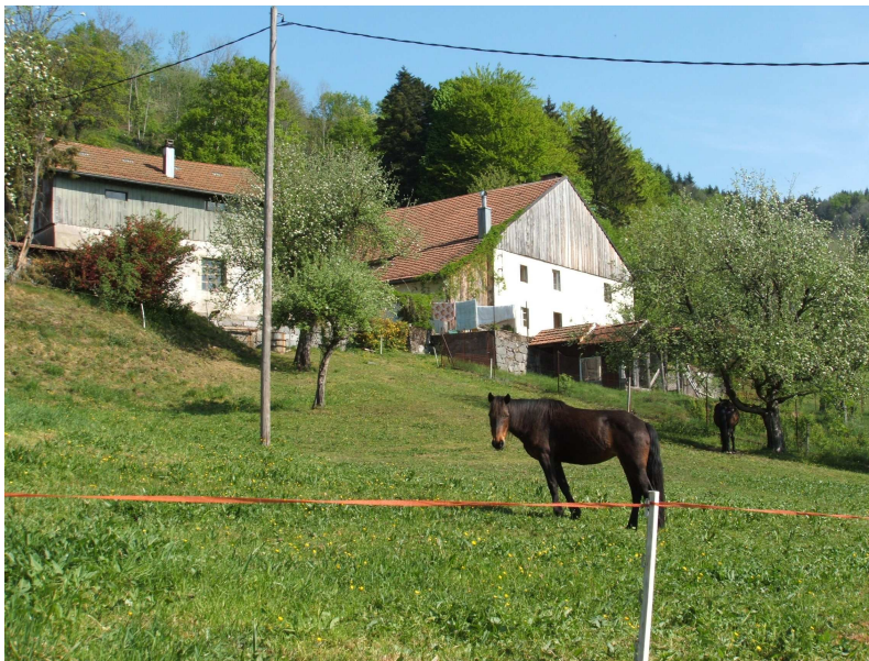
Photo 5 : L'élevage, comme désir d'ancrage "campagnard".

La pratique du jardin potager correspond à la même logique d'appropriation de l'espace local. On peut ici distinguer deux formes de pratiques : l'une qui s'ancre plutôt dans l'habitude, la répétition d'une pratique vernaculaire en tant que réminiscence du jardin de la ferme de polyculture ; l'autre, plus récente dans le temps, qui consacrerait le recours (retour) à l'autoproduction. La résurgence de cette forme d'agriculture de subsistance témoigne d'une relocalisation, par une recherche de proximité, en lien à une quête d'un "savoir d'où ça vient", mais aussi en termes de partage de connaissances et de sociabilité localisée. Ces logiques se retrouvent également dans la pratique du bûcheronnage, dont on a observé qu'il était un puissant facteur de partage entre anciens et néo, qui se retrouvent autour de la même fonction utilitariste du bois de chauffage. L'arrivée des nouveaux habitants peut également être motivée par un projet d'utilisation des anciens terrains agricoles. Certains développent alors des formes de petites unités d'élevage, qui ont à l'origine pour seul objectif celui d'alimenter le plaisir d'être là, mais qui, à leur façon, réactivent la fonction agricole de la ferme (cf. photo 5).