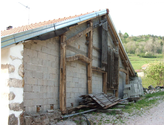
Photo 1 : L'aménagement du fenil comme nouvelle règle normative localisée

L'un des travaux le plus courant des rénovations récentes, ici en cours, vise à aménager l'espace du grenier à foin en un espace "habité". Cela nécessite une mobilisation importante de capitaux (pour l'aménagement complet) et transforme fortement la façade du pignon arrière qui était à l'origine "habillée" d'un bardage en bois.