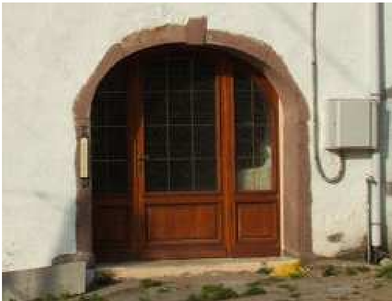
Photo 3 : La porte charretière, une allégorie revisitée

Cependant, on le devine, ce mouvement d'intégration à un modèle habité normalisé, ne tend pas à annuler totalement l'originalité de la ferme. L'habitat, revisité, porte des originalités qui deviennent des "caractéristiques" contemporaines. Ne serait-ce que par rapport à son volume, la ferme demeure un habitat particulier sur lequel on observe une diffusion de caractéristiques contemporaines communes à une majorité de notre échantillon. Dans le même esprit que la baie vitrée sur le pignon, la porte charretière, par exemple, est aujourd'hui investie d'un nouvel usage qui réinvente la fonction d'accueil de la ferme. La mise en place d'une porte vitrée est un modèle réinventé parfaitement exogène, qui est devenu populaire chez tous nos profils résidentiels (cf. photo 3). Cette dernière remarque rend évidente l'importance de la fonctionnalité dans les modes d'habiter. Cette fonctionnalité est certes normative, puisque l'aménagement en œuvre se plie aux exigences pratiques de l'époque, mais elle est négociée avec les caractéristiques de la ferme et tend à devenir une norme localisée.