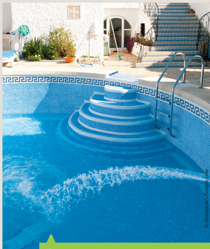
❶ L'eau consommée par un ménage répond à des besoins domestiques, mais également à des besoins liés à des pratiques récréatives comme le remplissage de piscine ou l'arrosage du jardin.