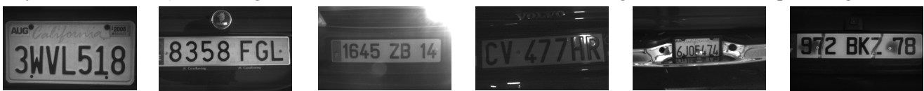
Figure 1 : images de qualité correcte devant être "lues" (à gauche), images capturées dans de mauvaises conditions pour lesquelles la lecture est espérée (au centre) et images mal capturées ou plaques ayant des défauts gênant fortement la lecture (à droite)

Le but de l'étude était de développer et d'intégrer un algorithme capable d'assister un opérateur humain à la reconnaissance d'une plaque d'immatriculation à l'aide d'un matériel de type PDA professionnel. Les contraintes techniques étaient de reconnaître un numéro d'immatriculation avec un taux de lecture satisfaisant en moins de 5 secondes, à partir d'une image monochrome de 752x480 pixels et en utilisant un système équipé d'un processeur 667 MHz et de 256 Moctets de mémoire fonctionnant sous Windows Mobile 2003. Les plaques devant être "lues" provenaient de plusieurs pays (Allemagne, Espagne, France, Hollande, Italie, Royaume-Uni, USA). Les images à traiter avaient été divisées en trois catégories comme indiqué en figure 1.