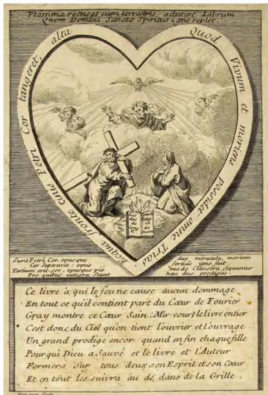
Document 14. Frontispice de La Conduite de la Providence dans l'établissement de la Congrégation de Notre-Dame, Toul, 1732.

Les scènes où Pierre Fourier est représenté « en majesté », avec à ses pieds des chanoines et des religieuses, sont un décalque évident d'un autre poncif médiéval de l'iconographie monastique : saint Augustin représenté comme un axe de symétrie entre moines et moniales. Pierre Fourier occupe un registre intermédiaire dans la construction de l'image, entre la Trinité et la Vierge, au sommet, et les religieux au niveau inférieur (document 15). Il figure ainsi un intercesseur essentiel et un vecteur entre le cloître et le ciel. Au parallélisme des registres se superpose un parallélisme vertical, puisque du côté blessé du Christ-Sauveur coule du sang qui atteint les chanoines, tandis que du sein de la Vierge s'écoule du lait que reçoivent les religieuses ; ainsi, chacun des deux instituts est explicitement placé sous la tutelle spirituelle qu'il porte dans son nom. L'image imposait donc à l'œil la place essentielle de Pierre Fourier dans la rénovation des ordres religieux au début du XVII e siècle et la nécessaire