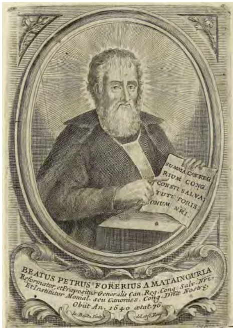
Document 10. J. B. Sinter, Beatus Petrus Forerius a Mataincuria , 1730.