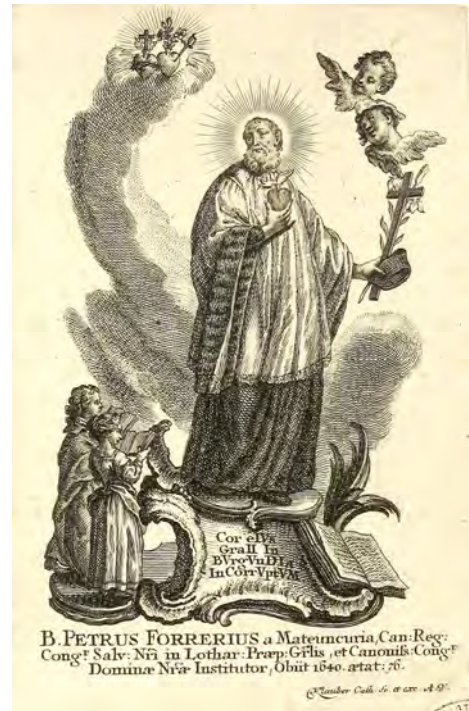
Document 7. Klauber (Augsbourg), Beatus Petrus Forerius a Mateuncuria , XVIII e siècle.

L'abondante production iconographique peut être regroupée en séries cohérentes, qui laissent deviner de nombreux réemplois, copies et plagiat.