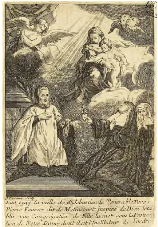
Document 11. J. Devaux, [Institution de la Congrégation Notre-Dame], fin XVII e siècle.

Ces codes liés à l'apparence du saint furent mis en scène selon d'autres poncifs. On s'attachera ici aux seules représentations de l'autorité de Pierre Fourier 65 sur les deux congrégations l'une réformée et l'autre fondée sous sa férule, représentations qui réemployaient, en les adaptant, des stéréotypes iconographiques médiévaux, particulièrement développés par les religieux placés sous la règle de saint Augustin – règle qu'observaient aussi les chanoines réguliers de Notre-Sauveur et les religieuses de