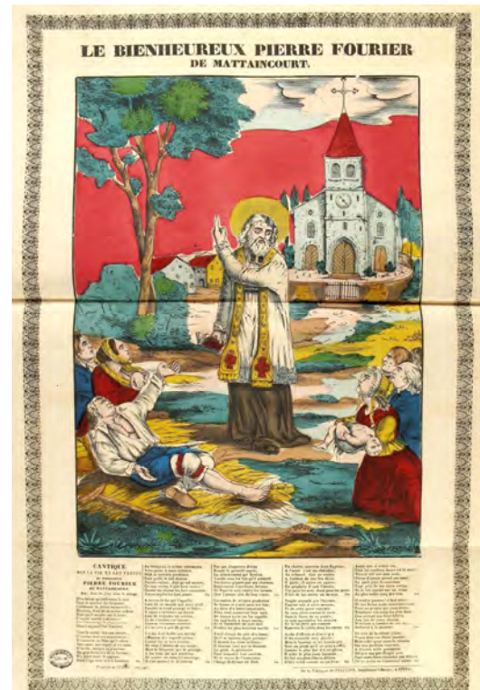
Document 9. Imagerie Pellerin (Épinal), Le bienheureux Pierre Fourier de Mattaincourt , XIX e siècle.