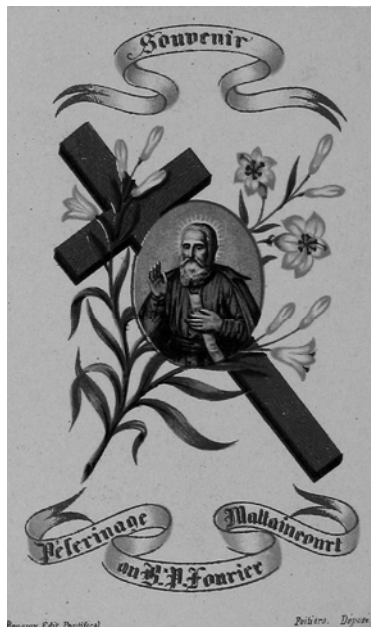
Document 8. Livret de pèlerinage de Mattaincourt, milieu XIX e siècle.

Au XVIII e siècle, alors que Pierre Fourier venait d'être déclaré bienheureux et que la Lorraine se ressaisissait de « son » Bon Père, de nouveaux graveurs reprisent cette effigie et la transformèrent pour l'adapter aux goûts et aux codes du moment. L'auréole fut ajoutée. Une série d'images, largement diffusée aux XVIII e et XIX e siècles, nous montre Pierre Fourier en habit de chanoine, la silhouette épaissie, sans ornement dévotionnel ou allégorique particulier. Le succès de cette représentation, en taille-douce ou en xylogravure au XVIII e siècle, en lithographie au XIX e siècle, laisse dans l'ombre des gravures de construction plus élaborée et plus riche en symboles comme celles, déjà évoquées, de C.-F. Nicole, Q. Fontbonne et des milieux artistiques germaniques. Cette tension entre l'image sobre produite, semble-t-il, par les milieux artistiques français, et une image d'origine germanique plus travaillée est caractéristique du double mouvement religieux du XVIII e siècle dans une Lorraine aux mains d'un clergé jansénisant mais où le goût du baroque et du spectaculaire avait toujours ses adeptes.