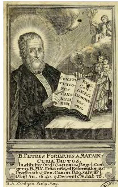
Document 5. B. A. Contgen (Mayence), Beatus Petrus Forerius a Mataincuria dictus , XVIII e siècle

Les éditeurs lorrains négligèrent donc relativement l'hagiographie, préférant exploiter la figure du nouveau bienheureux en vue d'une rénovation de la Congrégation Notre-Dame. Le P. Louis-Gaspard Bernard proposa au public une relecture magistrale des origines des réformes religieuses entreprises par Pierre Fourier, dans sa Conduite de la providence dans l'établissement de la Congrégation Notre Dame (Toul, 1732). Cet ouvrage se voulait un « retour à la source » de Pierre Fourier, l'auteur ayant constaté, au sein des monastères de la Congrégation, un progressif recul des exigences édictées par le fondateur 47 . La béatification, qui venait d'être prononcée, était un prétexte pour l'auteur de réactualiser dans l'esprit des sœurs l'idéal de Pierre Fourier et les « déviances » qu'il dénonçait étaient sinon réelles, du moins un moyen rhétorique de justifier son travail d'historien. Louis-Gaspard Bernard laissait aussi entendre que la querelle des Constitutions n'était pas terminée et il consacra un long développement à prouver que Pierre Fourier était bien l'auteur de ce texte 48 , et à enjoindre les religieuses d'abandonner les usages et mitigations locales pour revenir à la règle primitive. L'approbation donnée par l'abbé de Brisacier, grand vicaire de l'évêque de Toul, insistait aussi sur la nécessité de « dissiper les nuages qui se sont formés dans l'esprit de plusieurs [religieuses] au sujet des dernières constitutions de leur vénérable Père »,