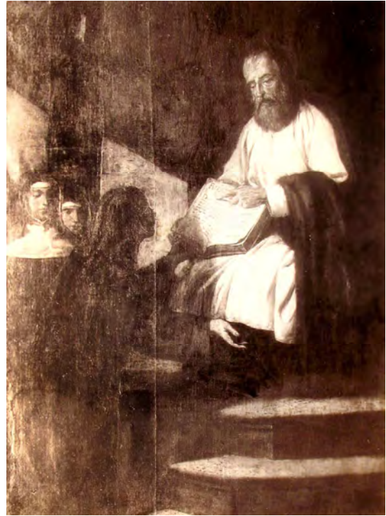
Document 13. Photographie d'une toile (?) représentant le « don de la règle » aux religieuses de la Congrégation Notre-Dame

sœurs leur obligation de se conformer aux normes édictées par leur fondateur. L'image participait de cette reconstruction historiographique entamée à la fin du XVII e siècle.