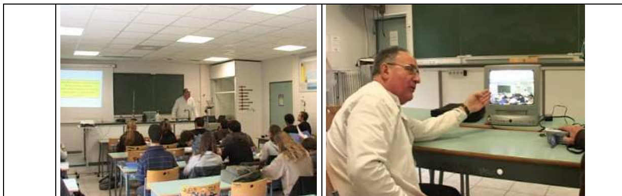
Figure n°2 : Récit réduit relié aux extraits vidéo de classe et d'autoconfrontation

Une troisième forme plus sophistiquée nécessite l'utilisation du logiciel Microsoft Excel et d'un ensemble de macros en Visual Basic, regroupées sous forme d'un Addin (partie complémentaire d'un logiciel de base) nommé SIDE-CAR (Perrin, Theureau, Menu et Durand, soumis). Cet outil, cohérent avec les présupposés du cadre théorique du cours d'action, vient d'être récemment développé pour faciliter l'analyse des traces de l'activité. De ce fait nous ne possédons que peu de recul sur son utilisation. Il se présente à l'utilisateur sous forme d'un tableau composé d'une série de colonnes qui permet successivement l'enregistrement de l'activité puis des autoconfrontations effectuées avec les différents acteurs (Figure 1).