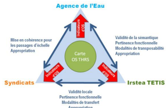
Figure 2: Les apports réciproques