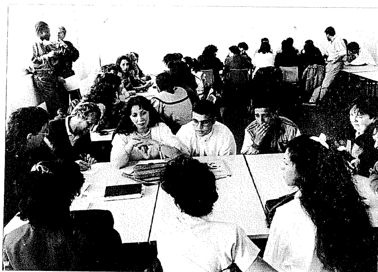
Rentrée de l'université. Les trois groupes au travail.

En pratique, il est rare de voir la nouvelle ligne générale s'incarner dans une logique d'action cohérente. Les observateurs de la politique de la ville relèvent que les habitants sont beaucoup invoqués, pas souvent vus à l'œuvre ; que les projets soutenus financièrement perpétuent parfois en les gonflant les fonctionnements antérieurs de type assistantiel et bureaucratique. Il faut certes