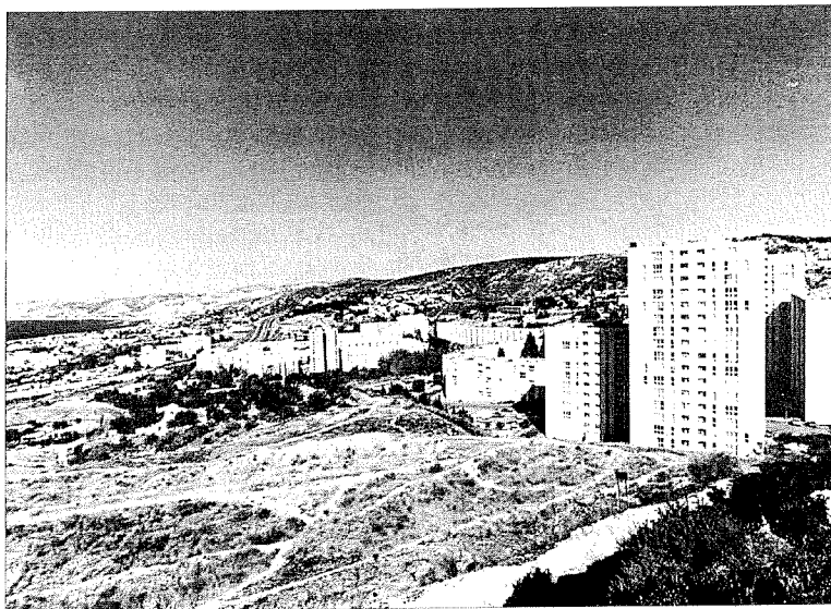
Deux des trois cités concernées, au-dessus de l'Estaque.

En France, seul l'État peut instaurer un tel espace, qui égalise théoriquement les poids symboliques du fort et du faible. Il le peut au nom de l'intérêt général, qu'il a en charge. Cela ne veut pas dire qu'il le fait. Cependant, une doctrine administrative nouvelle lui en fait un devoir. C'est celle de l'État régulateur, « stratège et garant de l'intérêt général » 5 . Cette doctrine repose sur la critique du traitement administratif des problèmes au sein des appareils de l'État, sans prise en compte suffisante des avis des usagers et des résultats effectifs de l'action publique. A l'opposé, l'État «stratège» privilégierait « l'effort de connaissance partagé avec les acteurs économiques et sociaux, la mise en œuvre des décisions publiques par des services à l'écoute des usagers, l'évaluation systématique des politiques publiques ». Cette doctrine nouvelle, justifiée par l'analyse des défis auxquels est exposée la société française des années 1990