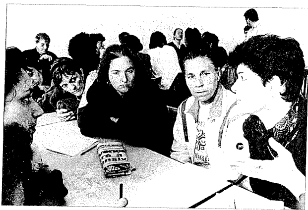
Au premier plan, animatrice du centre social de Castellane.

Lors de son lancement au printemps 1992, l'opération de référence était prévue pour durer trois mois, et elle réunissait trois groupes d'habitants sur un thème de travail commun : l'école 7 . Mais au bout de trois mois, la séance de synthèse qui réunit les habitants participants avec les personnalités politiques (conseillers municipaux) et administratives (sous-préfet chargé de mission pour la politique de la ville, représentants de la Délégation interministérielle à la Ville et de divers organismes) ne fut pas la conclusion de l'expérience. Elle en fut un moment fort, et occasionna son rebond. Les habitants s'entendirent remercier officiellement de leur concours. Ils furent écoutés et encouragés. C'est seulement après cela qu'ils purent entrer directement en contact avec les enseignants des écoles des quartiers concernés, dans une démarche publique , à l'occasion de journées pour lesquelles les écoles allaient recevoir des remplaçants. Jusque-là, ils avaient été reçus essentiellement par les directeurs des écoles et des établissements. Avec le recul, le premier module trimestriel de l'opération apparaît donc avoir été une phase de qualification des habitants organisés dans l'«université du citoyen», en tant que partenaires de l'administration. En quelque sorte, il a fallu