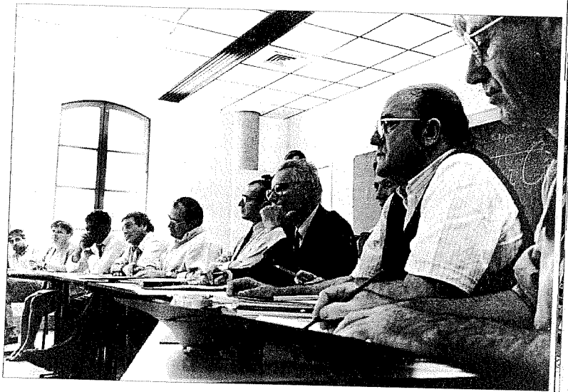
Synthèse. Le rang des personnalités.

Pour une institution publique invitée à réviser l'image qu'elle a de ses usagers et ses pratiques envers eux, et marquée par une sorte de confusion normative à cet égard, un dispositif tel que l'«université du citoyen»