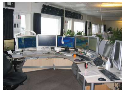
Figure 1. Poste de travail d'un opérateur dans un VTS.

Les VTS (Vessel Traffic Service) sont les centres de contrôle à partir desquels le trafic maritime est surveillé. Ils ont pour but d'améliorer la sécurité et l'organisation du trafic ainsi que de protéger l'environnement.