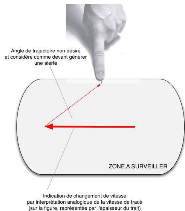
Figure 2 : exemple de définition de règle par geste analogique

Lors des interviews des contrôleurs maritimes ([3], [5]), on s'aperçoit que ces derniers cherchent à repérer des trajectoires anormales. C'est pourquoi les règles n'ont pas pour but de définir un comportement normal, mais au contraire d'établir les caractéristiques d'une trajectoire anormale. Chaque règle créée est rattachée à un ou plusieurs types de bateau, à une zone et à un opérateur. Chaque opérateur peut ainsi définir les règles de détection qui lui semblent les plus pertinentes, répondant ainsi au fait que chaque opérateur analyse différemment une situation [3].