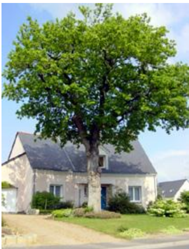
Arbre remarquable à préserver dans un lotissement d'Avrillé. (HD, 2003)

Plus au nord, dans la Z.A.C de l'Etang (un des quartiers les plus récents de la commune), la politique paysagère a été traduite par un règlement de lotissement dont l'un des objectifs vise à ce que la préservation des haies bocagères ne conduise pas pour autant à un cloisonnement des parcelles comme dans certains lotissements des années 70-80 où les haies de thuyas compartimentent très fortement l'espace. Le principe d'aménagement consiste donc à maintenir les clôtures en limite de façade des bâtiments, et non en limite de parcelle ; le procédé permet de dégager l'espace public perçu depuis la voie car la séparation espace public / espace privé est seulement matérialisée par une bordure presque invisible (d'autant que la plupart du temps les parties de chaque côté sont engazonnées). Malgré tout, les habitants outrepassent souvent la règle en édifiant de petits murets (d'une vingtaine de centimètres de hauteur) que la municipalité tolère tant qu'ils ne remettent pas en cause le principe d'organisation du lotissement. Ce ne fut pas le cas d'un propriétaire qui a été contraint de démonter la clôture qu'il avait installée en limite de la voie publique pour protéger ses enfants du passage automobile. En effet, en donnant l'illusion d'un élargissement de l'espace public, cette règle paysagère a aussi contribué à sécuriser l'automobiliste et par voie de conséquence à augmenter la vitesse de circulation.