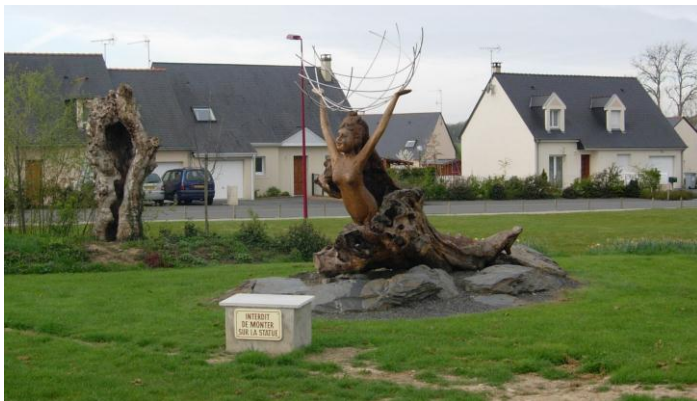
Trogné et fée Viviane, sculptures symbolisant le bocage et la forêt. HD, 2003

Lorsqu'il s'est agi de trouver les modalités pour répondre à la volonté des élus locaux de protéger les haies bocagères, les représentants agricoles départementaux ont refusé d'inscrire dans le POS les haies au titre des « espaces boisés classés » (possibilité offertes par la loi paysage de 1993). Opposés à toute contrainte réglementaire, ils ont seulement toléré que le plan de zonage identifie un « maillage structurant » sans valeur juridique. Sur cette même commune, un conflit ouvert s'est déclenché à propos de la ZAD (zone d'aménagement différé) de l'agglomération projetée sur une forêt privée et ses abords. Les riverains se sont mobilisés pour lutter contre ce projet qui, à long terme, prévoit une ouverture au public de cette forêt périurbaine et qui nécessitera des expropriations sur les terres agricoles. Ce conflit freine aujourd'hui la réalisation du sentier communal (l'une des mesures paysagères du POS) devant anticiper cette réalisation en proposant un accès à la forêt depuis le bourg.