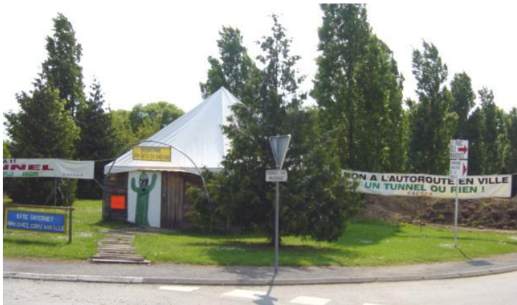
Camp de l'association CACTUS installé sur un giratoire d'Avrillé (HD, 2003)

Pour autant, le discours sur les paysages n'aura pas été confisqué par les opposants. Le « Livre blanc » où sont consignés les principes qui guident la réalisation de l'infrastructure, développe également un argumentaire paysager... excessivement optimiste pour la presse locale qui en rendra compte sur un ton souvent très ironique, moquant une autoroute qui aura même été présentée comme une « autoroute-jardin » : « Ce pays d'élevage et sa trame arborée se donneront pour partie à voir depuis une autoroute qui ne s'est pas encore totalement enfoncée et qui est donc susceptible de générer un dialogue paysager » (...), l'autoroute fournira une « possibilité de recomposition urbaine entre les quartiers », l'arrivée des usagers sur les basses vallées angevines « doit être un véritable événement paysager », comme le nouveau pont qui est « une véritable respiration avec la rivière et la ville historique ».