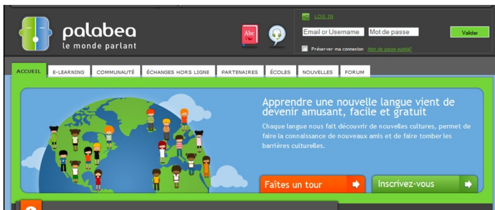
Figure 1 - Page d'accueil du site Palabea.net .